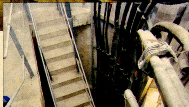
Lejárat az alvilágba

Pestre itt, a Duna alatt juttassák el az áramot. Ez a második világháború éveiben azért vált fontossá, mert a közműveket, illetve az elektromos vezetékeket a két városrész között kizárólag a hidakon vezették át. Ezek felrobbantása esetén azonban megbénult volna a város. A kivonuló német csapatok valószínűleg ugyanebből a megfontolásból szándékoztak berobbantani az alagutat, ám ezt végül sikertelen megakadályozni, így