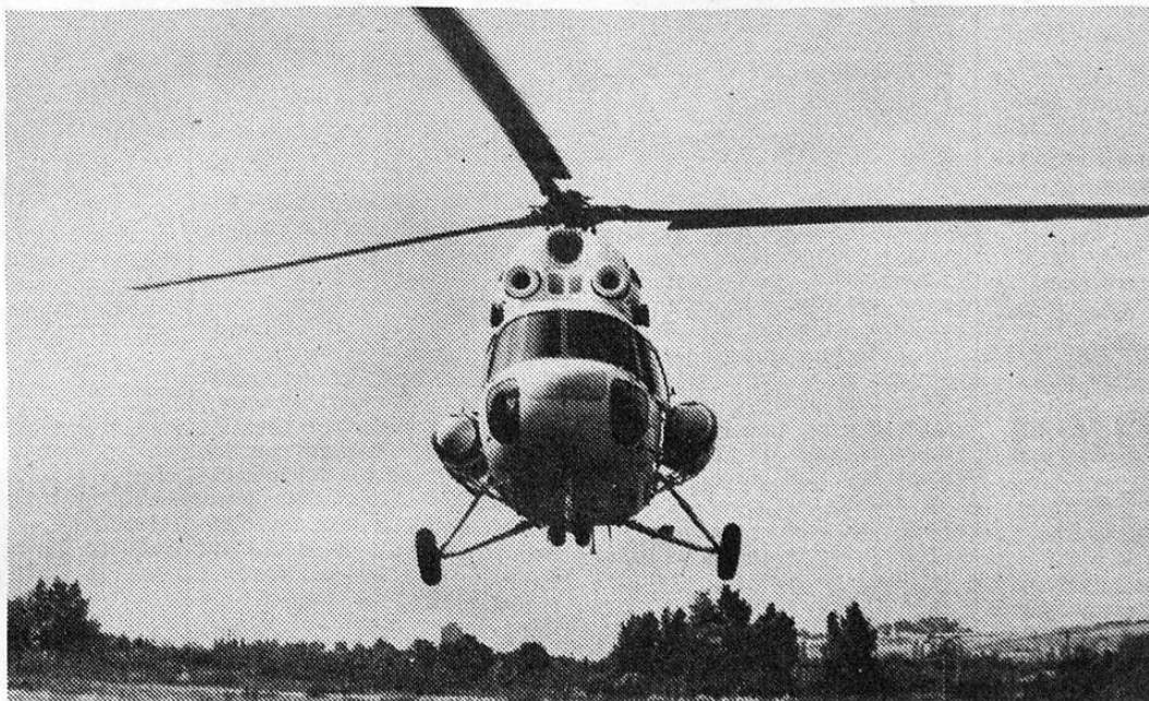
... Itt a HA-BCGI 7.20-kor startoltam, úticélmom Nyékládháza. Napkeltétől napnyugtáig című írásunk az Aerocaritas tevékenységét mutatja be az 5. oldalon.