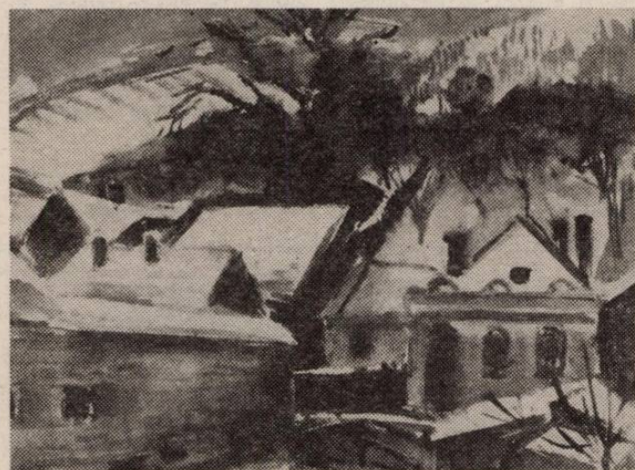
Tenkács Tibor festménye

ták, így önkézével törével saját magát szúrta szíven.