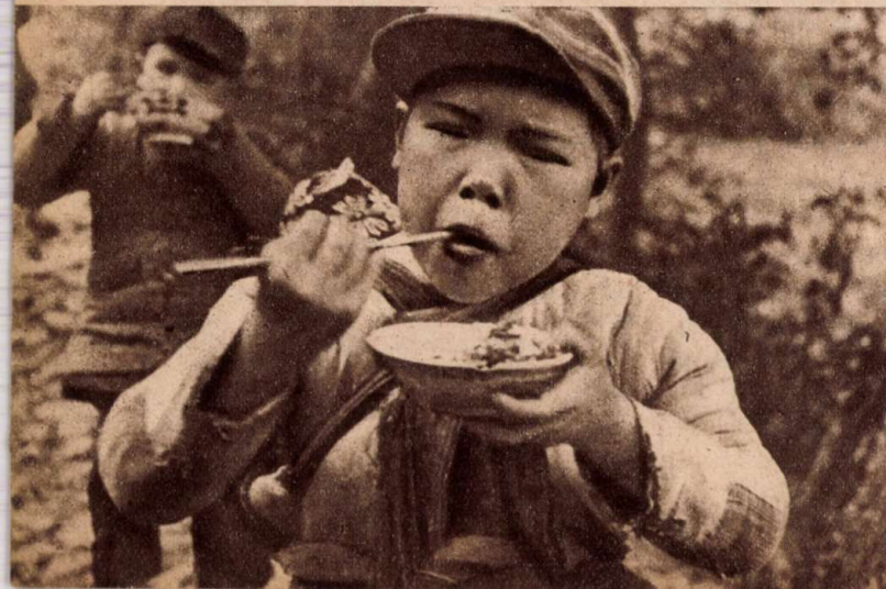
A kínai fiúcska — hátán kis testvére — fűrgén kotorja szájába a rizsszemeket

Szétnéztem a kis lakásban. A falakra — a hagyományos szerencsejel és néhány színes plakát mellé — kis családi fényképeket szegeztek fel. A bútortat három egyszerű deszkaágyból, egy kis asztalkából és egy kőből épült primitív tuzhelyből állt. Az ágyakon vattamatracok, az asztalon könyvek, újságok, a tuzhelyen két beépített vasedény... Ez utóbbiak méter szélesek, de alig 15—20 cm mélyek. Az egyikben