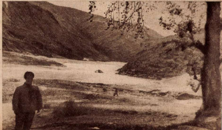
A vad Jangce folyó, Jünnan északi határán