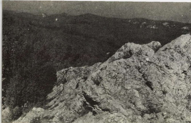
Kilátás a Látó-kövekről a Bükk legidősebb, északnyugati részére. Fehér pontként látszik a háttérben a dédesi várhegy sziklaszirtje

távol kerültek a partok, a sós vizet nem hígította édes víz, és a meleg éghajlaton elszaporodtak a sós tengervíz kedvelő szervezetek. Megjelentek azok az őslények a Bükk hegységtől egészen a Mecsek, Villány vidékéig, amelyek léte sós tengervízhez kötődött. A triász közepén a tengermedence erős süllyedésnek indult, vízében hatalmas tömegben éltek a zöld algák. Ezek léte tiszta, normális sótartalmú vízhez volt kötve és mivel fotoszintézist folytattak, csak olyan mélységig élhettek, ameddig a fény sugar lejutott. A triászban ekkor voltak az első kisebb vulkáni kitorések, amelyek főleg tengervízben lerakódott törmelékanyagot, részben víz alatt megszilárdult lávákotzeteket szolgáltatottak. A változatos vulkáni anyagot megtaláljuk pl. Lillafürednél.