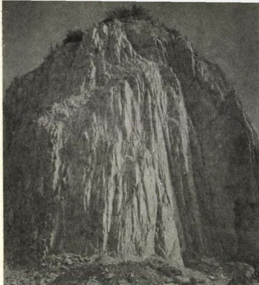
A Bükk-fennsík triász idôszaki mészkôrétegei a hegységképzôdés során meredek helyzetbe gyûrôdtek, sokszor függôlegesen állnak. Ez a jelenség különösen az „ôrt álló” hegységperemi köveknél figyelhetô meg

fiatal üledékekbôl álló térszínen halad. Itt van az Egercsehi—Ózdi-barnaszénmedence déli határa. A miocén korban itt három széntelep fejlôdött ki, az egykori szubtrópusi növényekbôl (ôsfenyôfélék, füge, pálma, babér, magnólia). A telepek közötti homokrétegekben és a fedôben sokszor nagy nyomású vizek veszélyeztetik a bányászatot. Az egercsehi bánya századunk elején a bélápátfalvai cementgyár energiaellátására létesült.