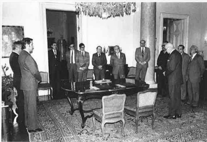
A Magyar Földrajzi Múzeum megalapításának dokumentumát a Magyar Tudományos Akadémián írták alá