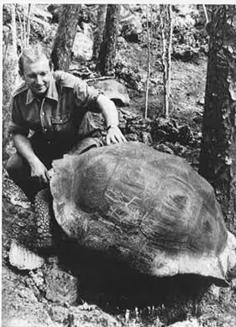
Egy elefántteknőssel, Galápagos-szigetek, 1969