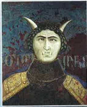
Címlap: Ambrogio Lorenzetti: A jó és a rossz kormányzás allegóriája, részlet (Siena, Városháza) – illusztráció Órdögűzés tudománya? című cikkünkhöz