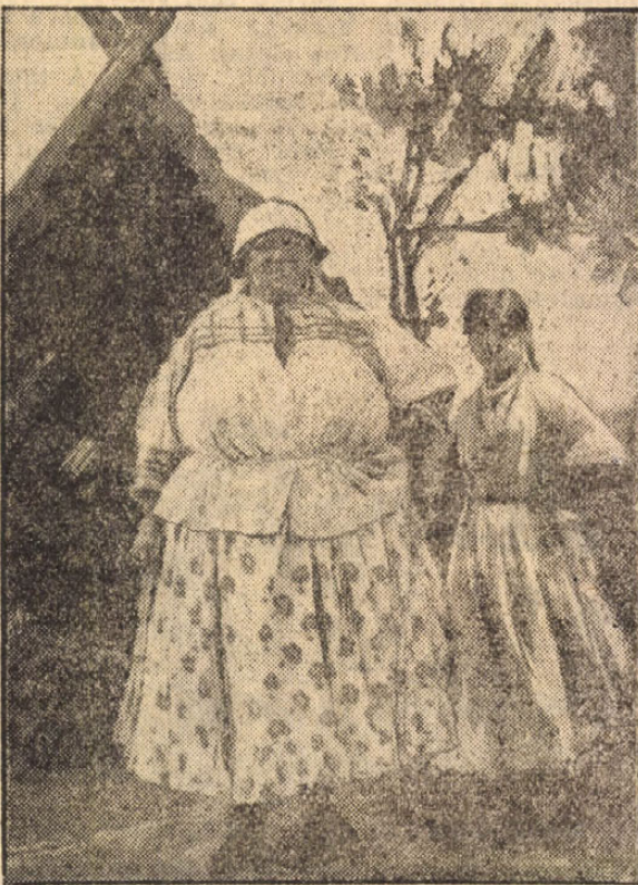
Az elvirágzott és a himbózó cigányszépség.

cigányokat, hogy egyre-másra beadják a derekukat és rendes, nyilvántartott polgárai legyenek a hazának. Igaz ugyan, hogy így is nyilvántartjuk őket, mert hiszen nem üzhetnék házaló, kereskedő