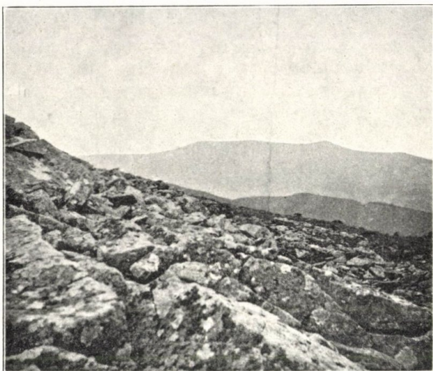
A Bihar látképe a három vármegye határesúcsáról.

De ne maradjunk lenn a völgyekben, hanem emelkedjünk fel. A szabadság megtestestüléseinek érzése fog el, midőn e hegycsoport legmagasabb csúcsáról körültekintünk és szemünk nyolcz vármegyének kimagasló pontjain pihen meg, nyugat felé pedig a messze végtelenben vész el tekintetünk, ott, ahol a kalással ékes rónaság élteti a magyarságot. Többször volt már alkalmam ennek a hegyvidéknek egyes szebb pontjait élvezni, így a Gyalui havasokat, a Vlegyászt, a Jára vizét, az Aranyos és a Kőrösök völgyeit, most mégis a legszebbek egyikét