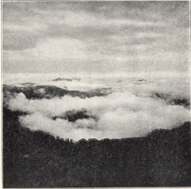
Felhőtenger a Gaina alatt.