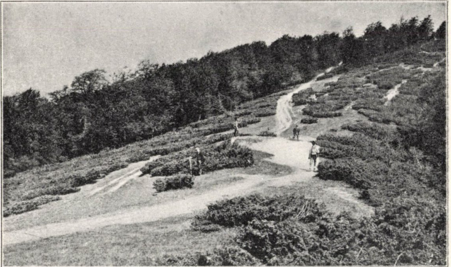
A Bihar-Gainai gerincez-út.

Reggelre az esőmérőben már lecsapódás némi nyomát találtuk, mert éjjelre kiderült és erős harmat keletkezett. Elhelyeztük a műszereket, az esőmérőt és hőmérőt megfelelő védőernyőben. Egyelőre csak ezek a műszerek kerültek fel, mert a felhőzet fokát és a szél járását csakis becslés alapján fogják észlelni. A napközben felmentünk a Gainára . Az 1486 m magas csúcsról gyönyörű kilátás nyílik.