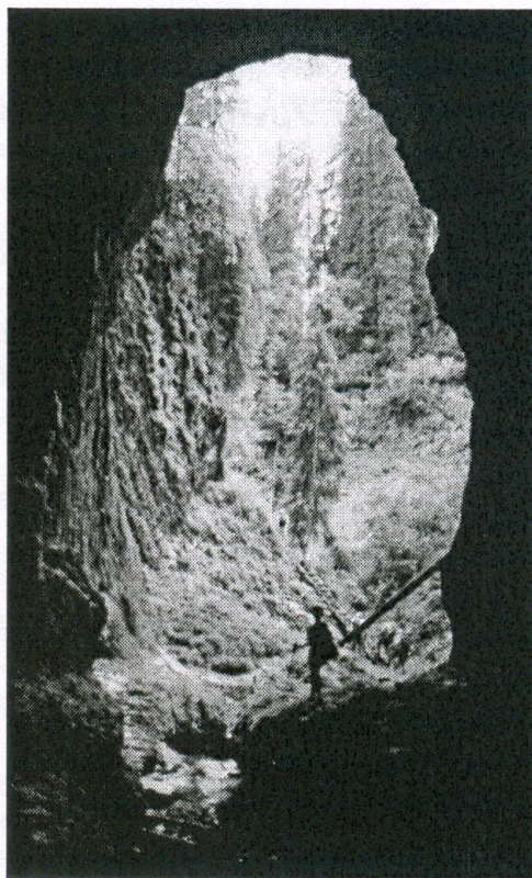
A Szamosbazár barlangalagútja Durchgangshöhle im Szamos-Schlucht

Ebből érdemes idéznünk Czárán magyarosítási szándékát az akkor még hiányzó szakszavakat illetően: Báb-oknak nevezem a barlang talajából felnyúló, alulról felfelé nőtt képződményeket (a stalagmitokat). Csap szóval jelölöm azokat, melyek felülről lefelé, a barlang mennyezetéről csüngnek alá (stalagtitok). Azon burkolatoknak jelölésére pedig, melyek a barlang falain végigszivárgó vízből képződve, ezeket mintegy páncélszerűen beborítják, a vért szót használom.