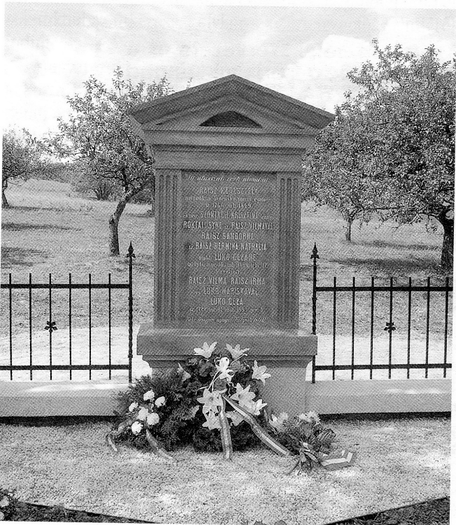
A felújított síremlék