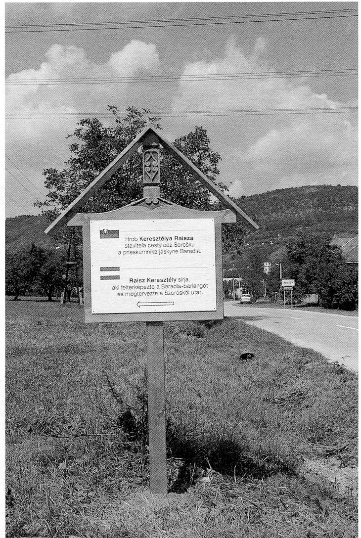
Tűjékoztató tábla.

Mindent pontosan megfigyelt és ezek a barlangra vonatkozó első pontos információk. Felismerte az általa Mausoleum nak nevezett teremben (ma: Csontház ) látott csontok