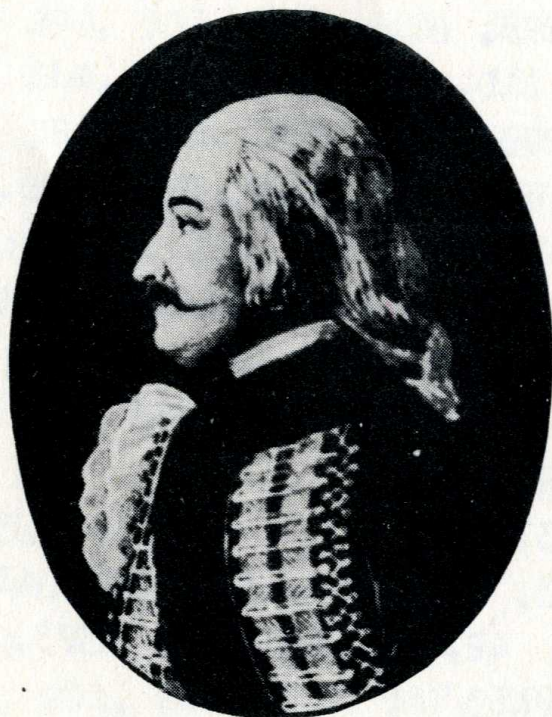
Gvadányi József 1725—1801

Zubogy 103, 168, 206, 412, 437, 481, 487, 489