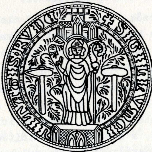
Rudabánya középkori pecsétje

Reméljük, hogy szerény munkánk megfelel az elvárásoknak.