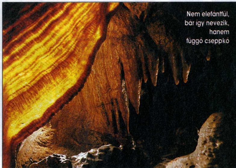
Nem elefántfűl, bár így nevezik, hanem függő cseppkő