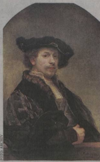
A Szépművészeti múzeumban Rembrandt remekait is láthatják

Február 15-éig látogatható a Rembrandt és a holland arany évszázad festészete című kiállítás a Szépművészeti Múzeumban. A nagyszabású tárlat a 17. századi holland művészetet mutatja be, és Rembrandt köré épül, akitől 20 remekművet láthat a közönség. A nemzetközi közreműködéssel létrejött kiállításon egyébként csaknem 100 festő 170 alkotását vonultatják fel két nagy te-