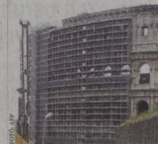
Ráfer a felújítás a Colosseumra