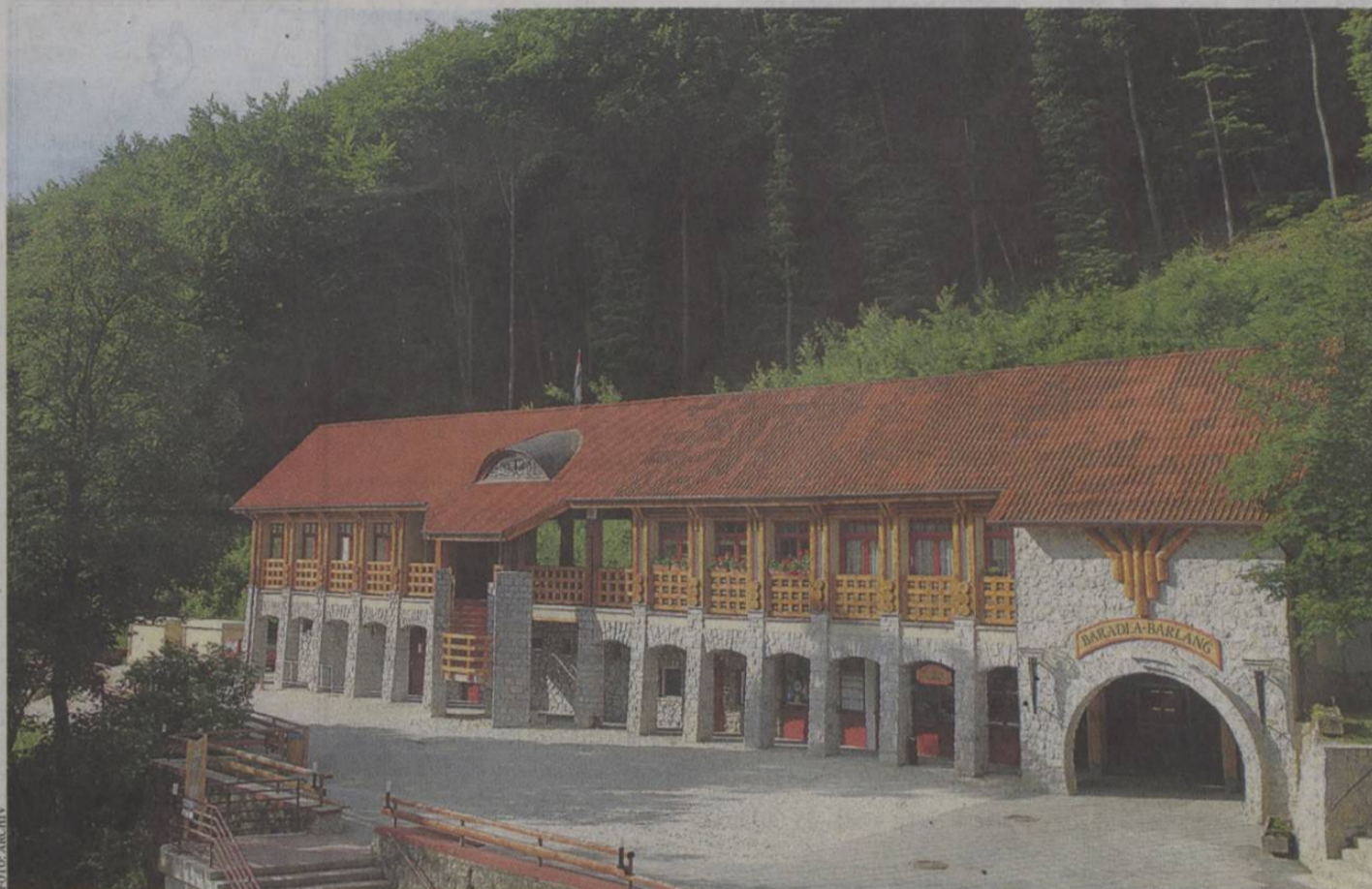
A Baradla-barlang bejárata Jósvafőnél – csodás cseppköveket láthat, aki betér

Idén Mikulástúrára is van lehetőség: az óvodás és iskolás csoportok november 27. és december 5. között hétköznapokon, a családok pedig november 29-30-án és december 6-7-én találkozhatnak a nagyszakállúval. A gyerekek és