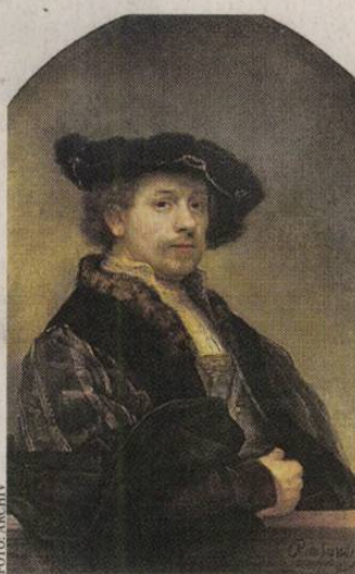
A Szépművészeti múzeum tárlatán Rembrandt remekait is láthatják

Február 15-éig látogatható a Rembrandt és a holland arany évszázad festészete című kiállítás a Szépművészeti Múzeumban. A nagyszabású tárlat a 17. századi holland művészetet mutatja be, és Rembrandt köré épül, akitől 20 remekművet láthat a közönség. A nemzetközi közreműködéssel létrejött kiállítás egyébként csaknem 100 festő 170 alkotását vonultatja fel két nagy te-