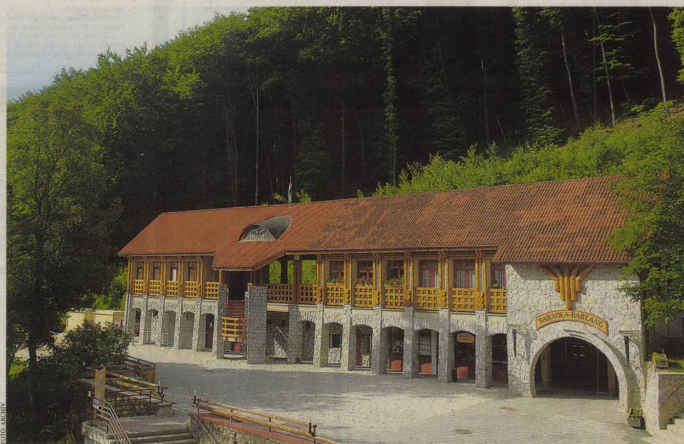
A Baradla-barlang bejárata Jósvafőnél – csodás cseppkőeket láthat, aki betér

Idén Mikulástúrára is van lehetőség: az óvodás és iskolás csoportok november 27. és december 5. között hétköznapokon, a családok pedig november 29-30-án és december 6-7-én találkozhatnak a nagyszakállúval. A gyerekek és