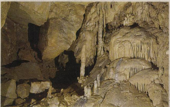
Az Abaliget-barlang nagytermében ez a látvány fogad