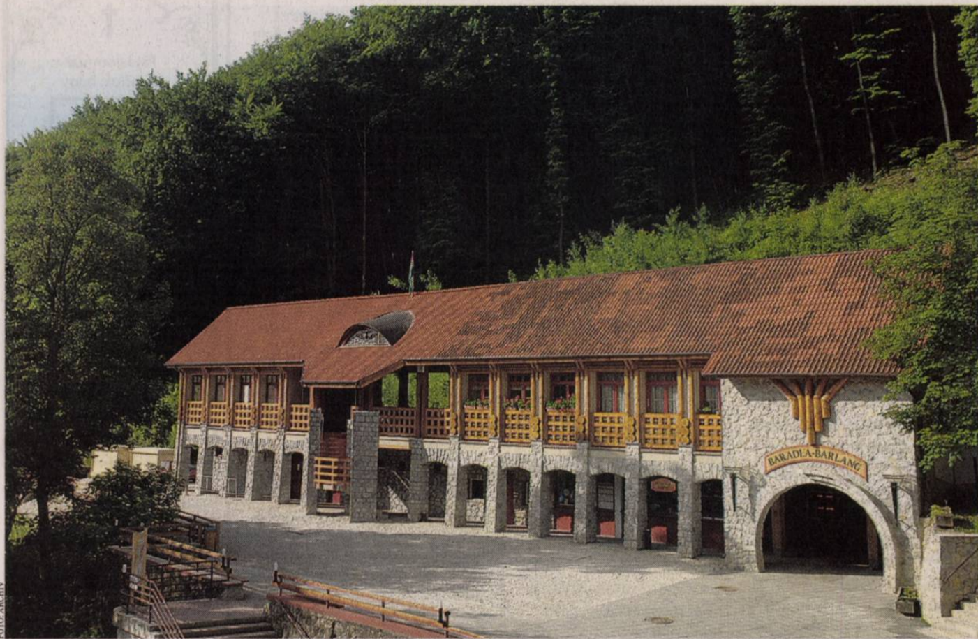
A Baradla-barlang bejárata Jósavfőnél – csodás cseppköveket láthat, aki betér

Idén Mikulástúrára is van lehetőség: az óvodás és iskolás csoportok november 27. és december 5. között hétköznapokon, a családok pedig november 29-30-án és december 6-7-én találkozhatnak a nagyszakállúval. A gyerekek és