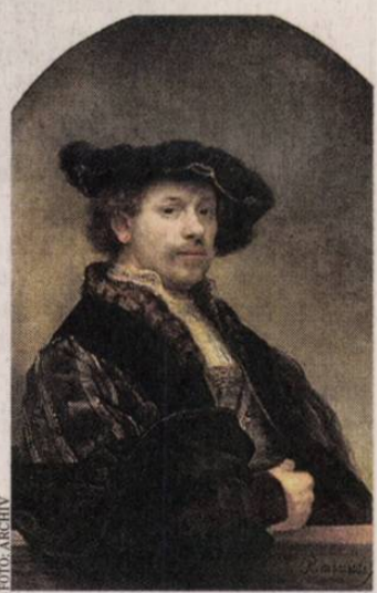
A Szépművészeti impozáns tárlatán Rembrandt remekét is láthatják

Február 15-éig látogatható a Rembrandt és a holland aranyévszázad festészete című kiállítás a Szépművészeti Múzeumban. A nagyszabású tárlat a 17. századi holland művészetet mutatja be, és Rembrandt köré épül, akitől 20 remekművet láthat a közönség. A nemzetközi közreműködéssel létrejött kiállításon egyébként csaknem 100 festő 170 alkotását vonultatják fel két nagy te-