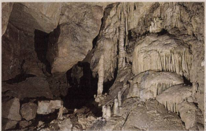
Az Abaliget-barlang nagytermében ez a látvány fogad