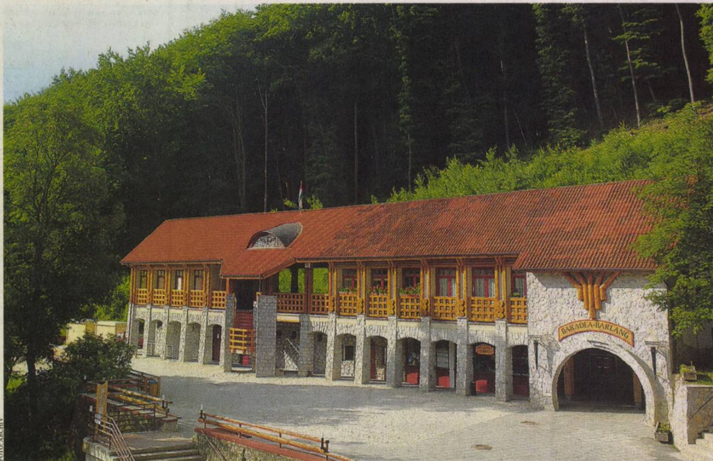
A Baradla-barlang bejárata Jósvafőnél – csodás cseppköveket láthat, aki betér

Idén Mikulástúrára is van lehetőség: az óvodás és iskolás csoportok november 27. és december 5. között hétköznapokon, a családok pedig november 29-30-án és december 6-7-én találkozhatnak a nagyszakállúval. A gyerekek és