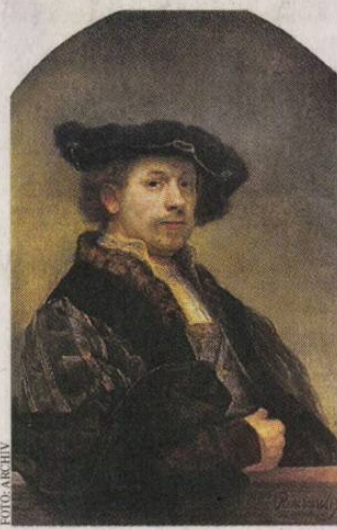
A Szépművészeti impozáns tárlatán Rembrandt remekait is láthatják

Február 15-éig látogatható a Rembrandt és a holland aranyévszázad festészete című kiállítás a Szépművészeti Múzeumban. A nagyszabású tárlat a 17. századi holland művészetet mutatja be, és Rembrandt köré épül, akitől 20 remekművet láthat a közönség. A nemzetközi közreműködéssel létrejött kiállításon egyébként csaknem 100 festő 170 alkotását vonultatják fel két nagy te-