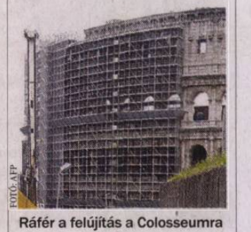
Ráfér a felújítás a Colosseumra

• Őt múzeum kincseit már a fotóból is megcsodálhatja a Google Art Project keresőjében. A Magyar Nemzeti Galéria, a Szépművészeti, az Iparművészeti, a Magyar Nemzeti és a Petőfi Irodalmi Múzeumot a www.googleartproject.com -ra rákattintva virtuálisan is kedvére bejárhatja.