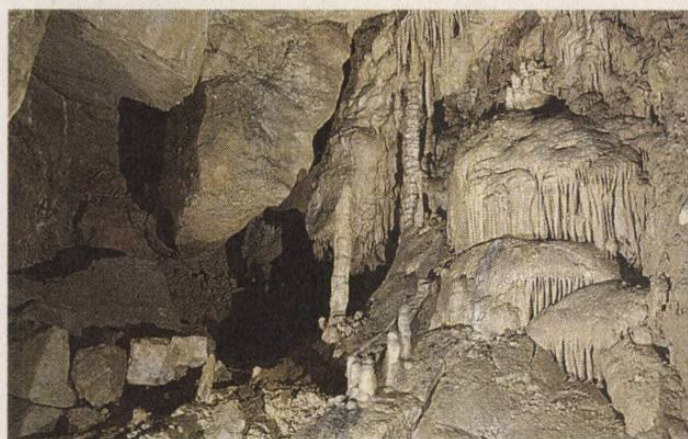
Az Abaliget-barlang nagytermében ez a látvány fogad