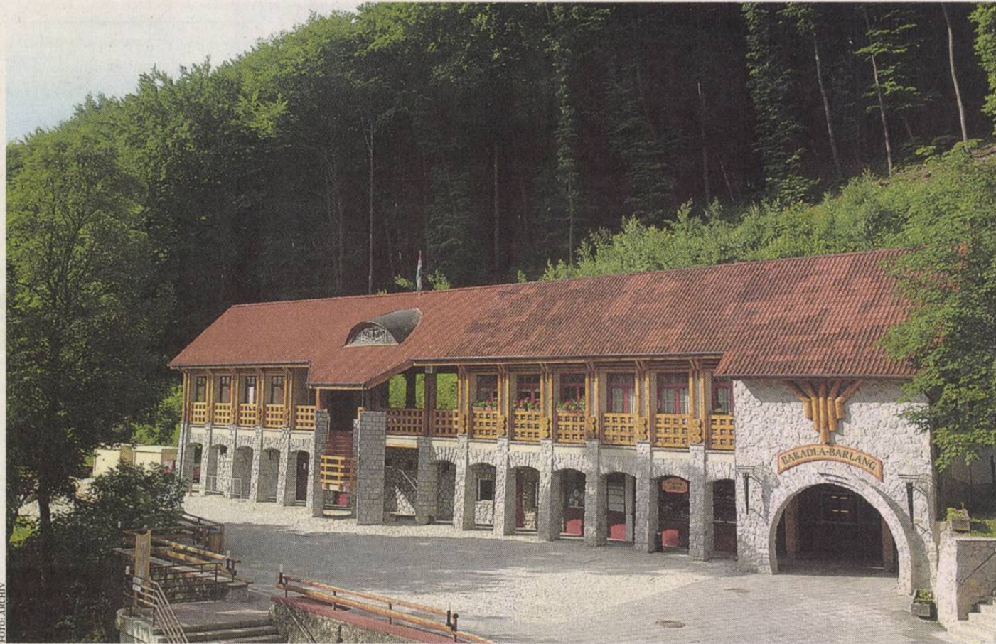
A Baradla-barlang bejárata Jósfaónél – csodás cseppköveket láthat, aki betér

Idén Mikulástúrára is van lehetőség: az óvodás és iskolás csoportok november 27. és december 5. között hétköznapokon, a családok pedig november 29-30-án és december 6-7-én találkozhatnak a nagyszakállúval. A gyerekek és