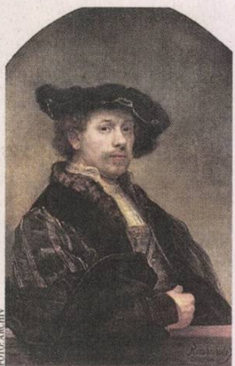
A Szépművészeti impozáns tárlatán Rembrandt rezműveit is láthatják

Február 15-éig látogatható a Rembrandt és a holland arany évszázad festészete című kiállítás a Szépművészeti Múzeumban. A nagyszabású tárlat a 17. századi holland művészetet mutatja be, és Rembrandt köré épül, akitől 20 rezművet láthat a közönség. A nemzetközi közreműködéssel létrejött kiállításon egyébként csaknem 100 festő 170 alkotását vonultatják fel két nagy te-