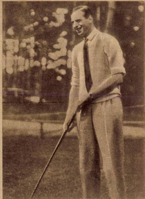
Egy királyfi, aki szobafogságot kapott: György herceg, az angol király negyedik fia egy Hollywoodban horgonyzó hadihajón teljesít szolgálatot s miután parancsnoki engedély nélkül elhagyta a hajót, a parancsnok harminc napi áristomra ítélte.