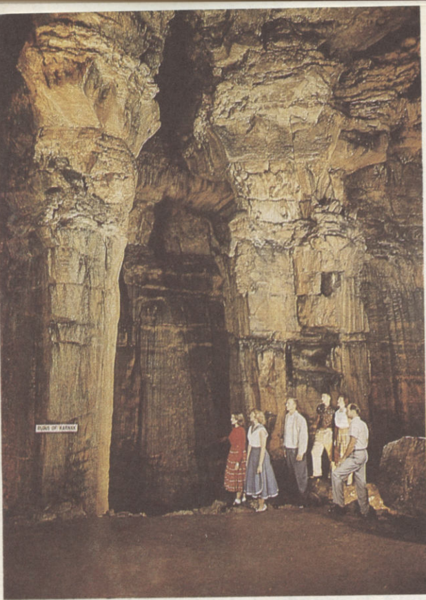
A „karnaki templom oszlopai” nevű képződmények a Mamut-barlangban