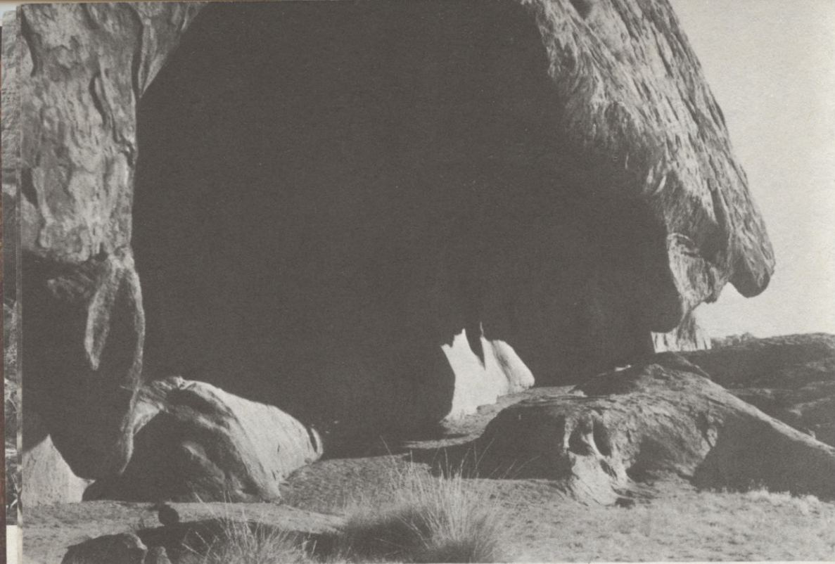
Az Ayers-szikla ereszei alatt még a közelmúltban is ausztrál „aboridzsinek” éltek

Amikor nemrég Japánban jártam, az ottani barlangkutatók meghívtak egy háromnapos túrára a szigetország szent hegyére, a Fudzsiszanra. (Nálunk hibásan Fudzsi-jamának nevezik.) Persze nem a 3776 méter magas csúcs volt expedíciónk célpontja, hanem a hegy gyomra. A Fudzsi napjainkban „alvó” vulkán, utolsó kitörése 1707-ben volt. Akkor a kirobbanó gáztömeg csak salakanyagot szórt ki, a vulkán utolsó lávaömlései 800-ból és 864-ből származnak. Ezekben a lávafolyamokban számos barlangot találunk.