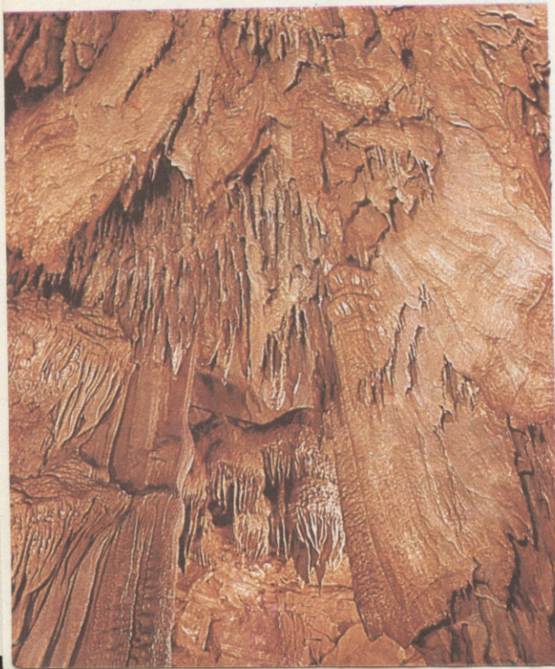
A Drapériák terme a Mamut-barlangban

aknak alakulnak ki, majd a folyó szintje magasságában – megközelítően vízszintes irányban – áramlik tovább a víz, tágítja barlanggá a kőzet hasadékát. Végül is a föld alatti patak a folyó menti forrásban tör fel a napvilágra.