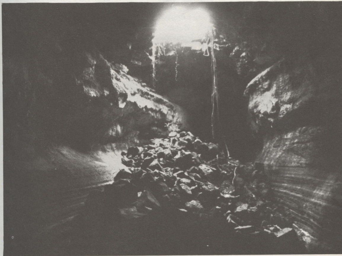
Lávabarlang felszakadása alulról szemlélve a Galápagos-szigeteken

... E néhány példa is mutatja, mennyi érdekességet rejteget sártekénk titokzatos föld alatti világa. Évről évre egyre több fiatal jelentkezik a szervezett barlangkutató csoportokba, hogy részt vegyen a barlangok titkainak felderítésében.