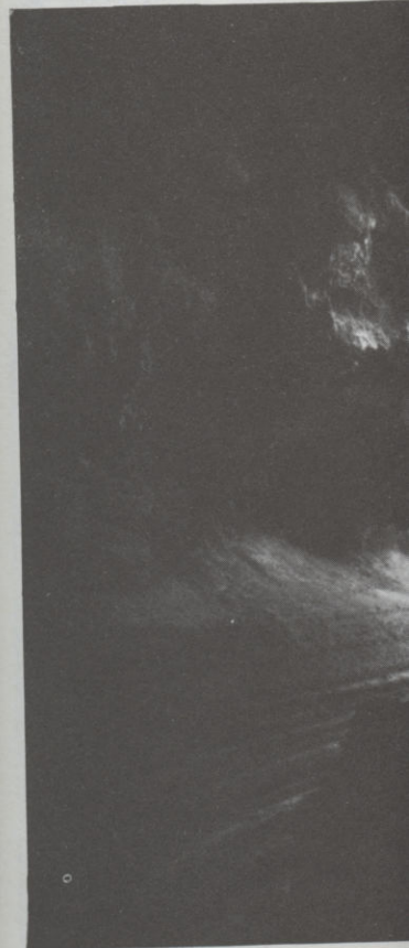
Lávabarlang felszakadása alulról

A lāvabarlangok belseje látványos, mint a karsztbarlangok. Apró sztalaktitok és sztalagmitok