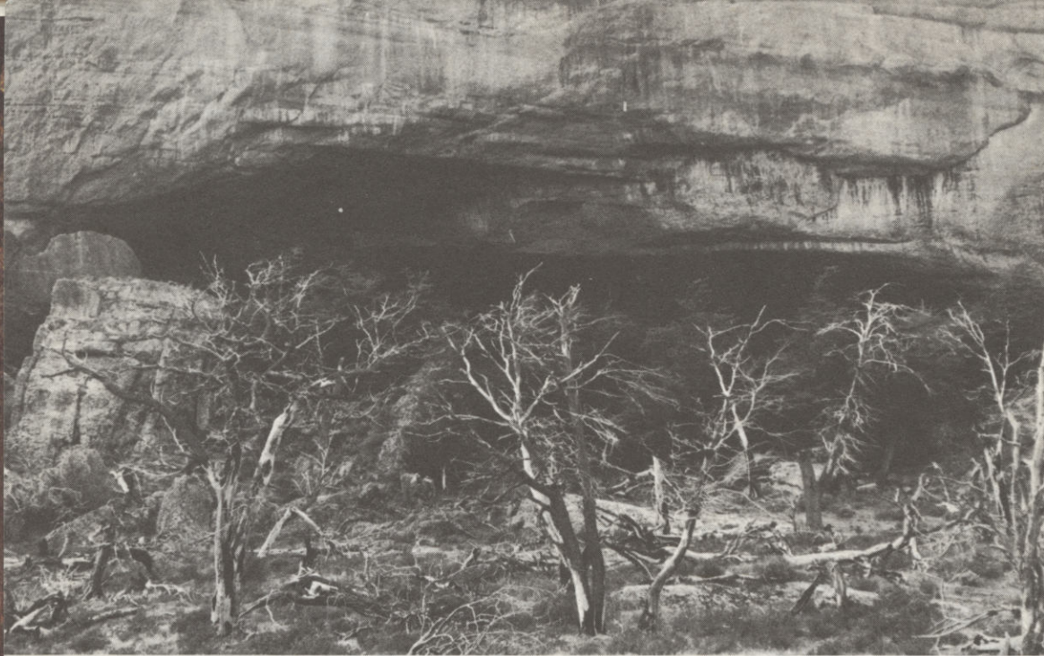
A Mylodon-barlang széles bejárata

ken élő állat bőre lehetett, mert egyikehez sem hasonlított. A barlang belső részében még több szőrös bőrlepelre bukkantak, sőt megtalálták az állat mancsainak maradványait is.