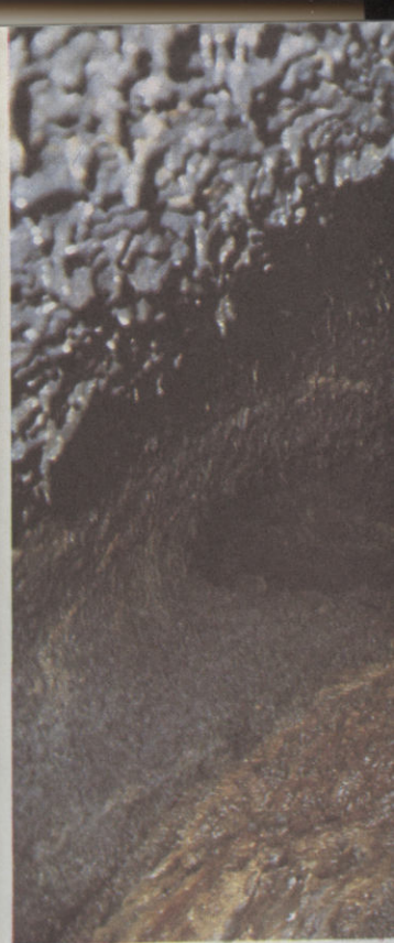
Részlet a Fudzsiszan egyik lávafolyásáról

ott nevezik őket, az aborigén emberiség legelmaradott csoportjai közé tartoznak. Az őslakóságok megpróbálják beilleszkedni a civilizációba, de még mindig vannak köztük, akik gőgösködnek az ősi életmódjukhoz. A sziklaeszek alatt épült házaikban gallyakból épült, azonban a vadászat és a gyűjtögetés már nem nyújt elég élelmiséget, ezért a kényesre kényszerülnek. A szikla környékén megtelepedtek az ideérkező turisták.