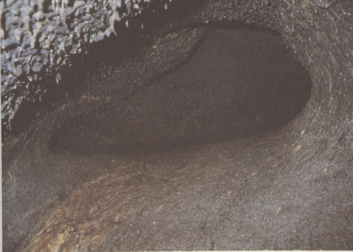
Részlet a Fudzsisan egyik lávafolyosójából, balra fent a mennyezeten lávasztalaktitok láthatók

kat, s ezáltal elindítja sődését. Ezt a vízfelvét kémiai mállási folya- őnek nevezik, és külö- vidékekre jellemző. Ayers-szikla mellett egy bb sziklaalakzat emel- moktengerből: a kis nek a lábánál is bar- ap heve elől ide akar- ni, de a bejáratánál az üregben ausztrál tak. Külsejük ijesztő l, lapos orrú, göndör torzonborz emberek. aráságosan fogadtak, arra biztattak, hogy ül- godtan közéjük a hús akói – vagy ahogyan