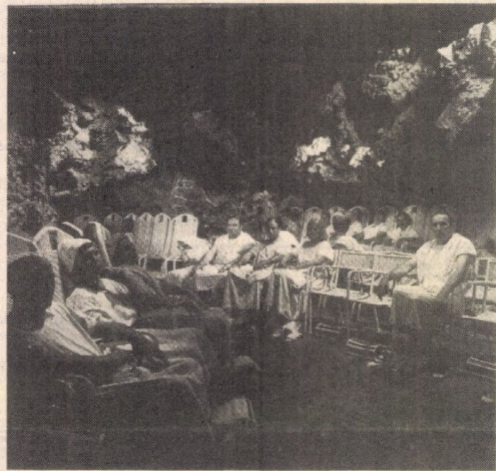
Az olaszországi (Firenze melletti) Grotta Giusti gyógybarlangban a mozgásszervi betegek valóságos izzasztókúrájában részesülnek.

lenül hat ki. Ennek elkerülésére úgy kell és lehet a betegek elhelyezésére létesítendő barlangszakaszt kialakítani, hogy az független legyen a barlangban folyó termálvíztől.