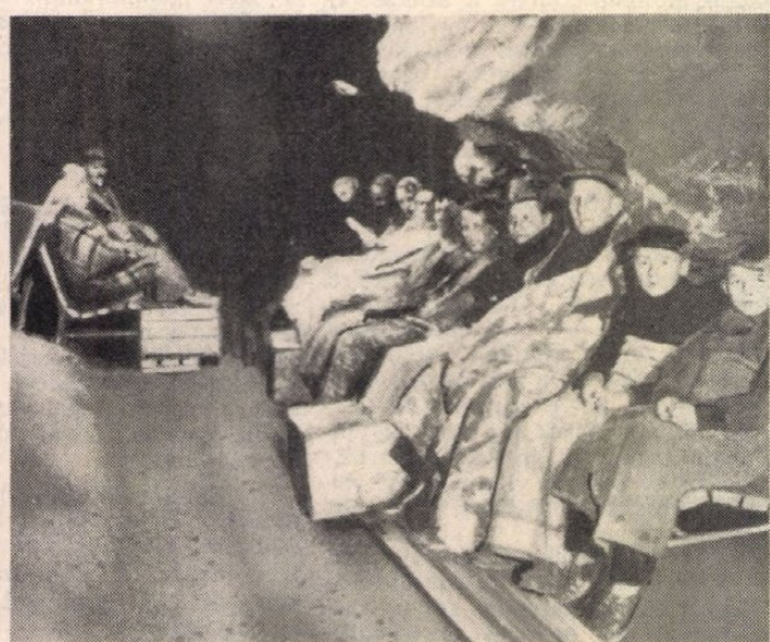
Légzőszervi betegek kúrja az NSZK-beli Klutert-barlangban. A pácienseknek az alacsony hőmérséklet miatt alaposan fel kell öltözniük.

Időközben azonban megszűnt a SZOT-épület gyógyüdülő jellege, és a kérdés ennek következtében lekerült a napirendről. Meg kell azonban jegyezni, hogy a barlang gyógyászati hasznosítását nem kell feltétlenül a SZOT-épülettel összekapcsolni. Sokkal egyszerűbben megközelíthető a barlang közelében levő romos és megfelelően újjáépítendő ún. Török-fürdőből nyitandó rövid mesterséges folyosóval. Az ügyben még régebben folytatott tárgyalások során a vízügyi szervek részéről olyan aggályok merültek fel, hogy a barlang gyógyászati hasznosítása a termálvíz minőségére esetleg kedvezőt-