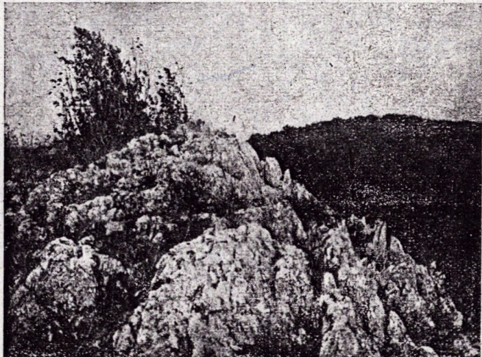
Karros-kúp a Bélkőn.

A mi Bükk-hegységünk úgynevezett felemelt tönk. Ez a kifejezés annyit jelent, hogy a Bükk valamikor jelentékeny