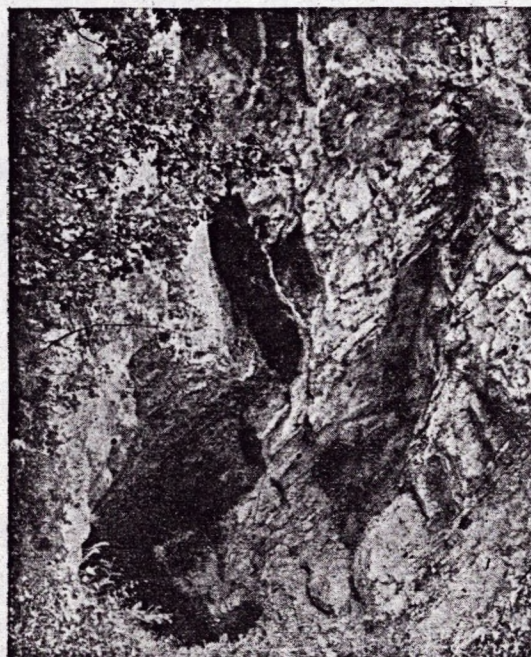
A Peskő-barlang torka.

szor született. Ennek a területnek zöme lekopott s ez teszi ma a Bükk középső tömegét, mely valójában nem is igazi hegység, hanem terjedelmes fennsík. Belőle emelkednek ki a legjelentékenyebb magasságú csúcsok: Istállóskő (959 m), Bálvány (956 m), Magas-Tető (987.6 m). A fennsík déli szélét meredek szakadék határolja. Minden bizonynal ennek mentén történt a hegy tönkjének második feltolódása. A szakadék peremét alkotó csúcsok (Bélkő, Peskő, Símakő, Tarkó, Hegyeskő, Vöröskő, Háromkő) mind meztelen falú sziklából állanak, me-