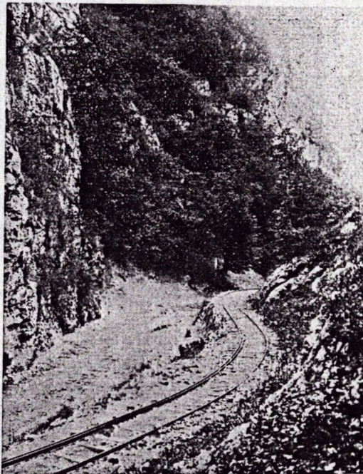
A felsőtárkányi Kőköz a lillafüredi út kiépítése előtt.

Talán egy pontja sincs a Bükknek, amely a karsztosodás minden tünetét oly nagyszerűen mutatná, mint a Bélkő. Ez a pogány Beél vagy Bél törzs nevét viselő hegyecsúc a fennsíkot délről beszegő kúpok közt a sarokbástya. Széles háta, ormótlan tömege riadt felkiáltójelként szakad ki az Eger-patak völgyéből. Mellső, nyugati oldala egészen le van gyalulva. A hegy derekán a kőfejtők vájta plató s mögötte a lerobbantott, élére állított iszonyú mészkőrétegek, csorba, töredezett csúcsokkal, széles repe-