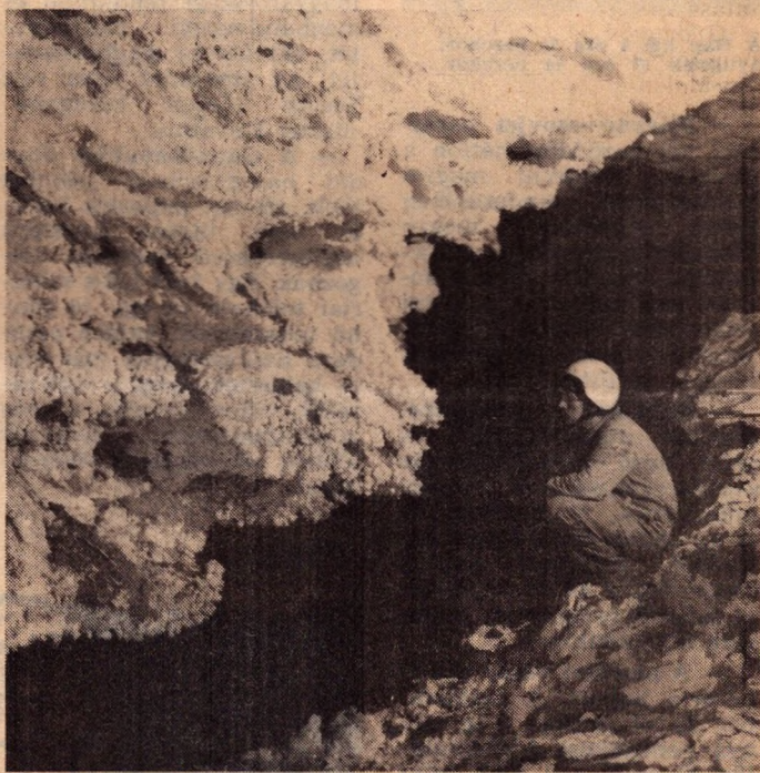
Feltáruuló új világok (József-hegyi barlang)

— A Dél-Dunántúl Magyarország és Európa egyik legkiemelkedőbb természeti értéke, Szársomlyó nagy veszélybe került. A rajta folytatott mészkőbányászat egy ideje sok kárt okoz: a morfológiai ritkaságnak számító karsztmezőt és a rajta megtelepedett páratlan növény- és állatvilágot a megsemmisülés fenyegeti. A táj képe erősen romlik: a bányafalak már harminc kilométeres távolságról látszanak, a bánya üzemeltető megszegve az előírásokat, nem készítettek sem tájrendezési, sem re-