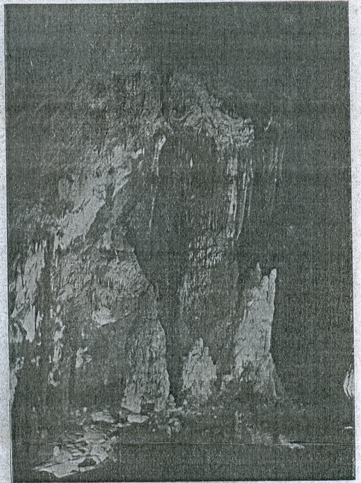
3. kép. A révi Batrina-barlangból. A nagy oszlopcsarnok. Bíró Lajos fölvétele 1904.

hagyjuk el a föld mélyének csodás világát. Egy-egy ilyen kirándulás jobban megkedvelteti velünk a természetet, mint száz könyv. Az ilymódon szerzett