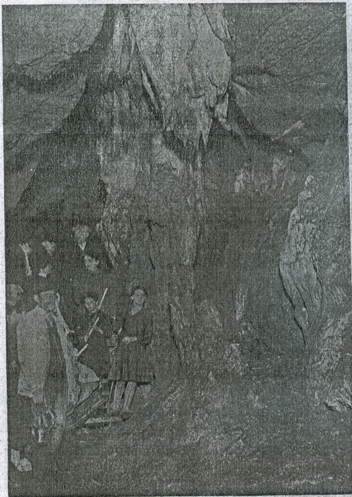
2. kép. Zichy-barlang. Szent Pál oszlopa.

hatók pókláb-alakú, belül üres cseppkövek is, amiket még egyetlen cseppkőbarlangban sem találtak. Az alakzatok közül a legérdekesebbek: a nyoszolya, a gyertyáktól körülvevő magyar korona, mely egy párnán nyugszik; 6—8 méter magas gyönyörű oszlopok stb. A barlang egyik felső traktusa az ú. n. Olympus, a legszebb valamennyi között. Nyolctíz méteres oszlopsorok vezetnek az első emeleten levő «függő kerthez», amely pálma-alakú cseppkövektől nyerte a nevét. A második emelet, az ú. n. «királysátor», mely előtt a «kucsmás legény» áll őrt. A harmadik emeleten van Szt. Nikoláj, az öreg hitvespár és még egész csomó emberalak; végül a barlang legmagasabb része, az Istenek oszlopcsarnoka. Megrendülve hajtja itt meg kevély fejét az ember. A gyermekmesék csodabarlangjai elevenülnek meg szemünk előtt. A mennyezetről különböző nagyságú és színű cseppkőcsapok lógnak le, amelyek között még átlátszó is akad. A falak és a padló vakítóan fehér habkővel és mésztufával vannak borítva. A bejáratnál két obeliszk áll, melyen belül szoboralakok által körülvevő oltár díszesleg.