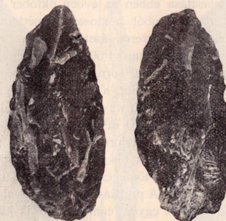
1. ábra. Csőkevényes babérlevélhegyek a Puskaaporosi kőfülkéből. (Késői solutréen.) Term. nagys.

tintott darabok legnagyobb része megmunkálatlan szilánk, melyeknek társaságában ezuttal 8 babérlevélhegy is találtatott. Utóbbiak alapján a puskaaporosi kőipart a solutréenbe kell helyezni. Az idézett dolgozatomban is kiemelttem azt, hogy a puskaaporosi solutrei kőipar nem egyezik teljesen a szeletaival, amennyiben a Puskaaporosi kőfülkében gyűjtött babérlevélhegyek megmunkálásukban fölületességet árulnak el s a szeletai pompás babérlevélhegyek eddig itt teljesen hiányoznak. Ebből azt vélem következtethetni, hogy a puskaaporosi solutréen kőipar a szeletainál fiatalabb, tehát a késői solutréenbe tartozik. Olyan időszak ez, amelyben a szép babérlevélhegyek először hanyatlani kezdenek, azután pedig teljesen eltűnnek.