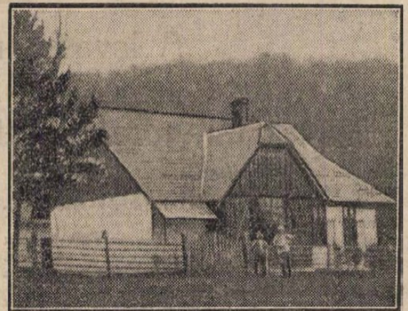
A jávorkúti vadászlak a Bükkben