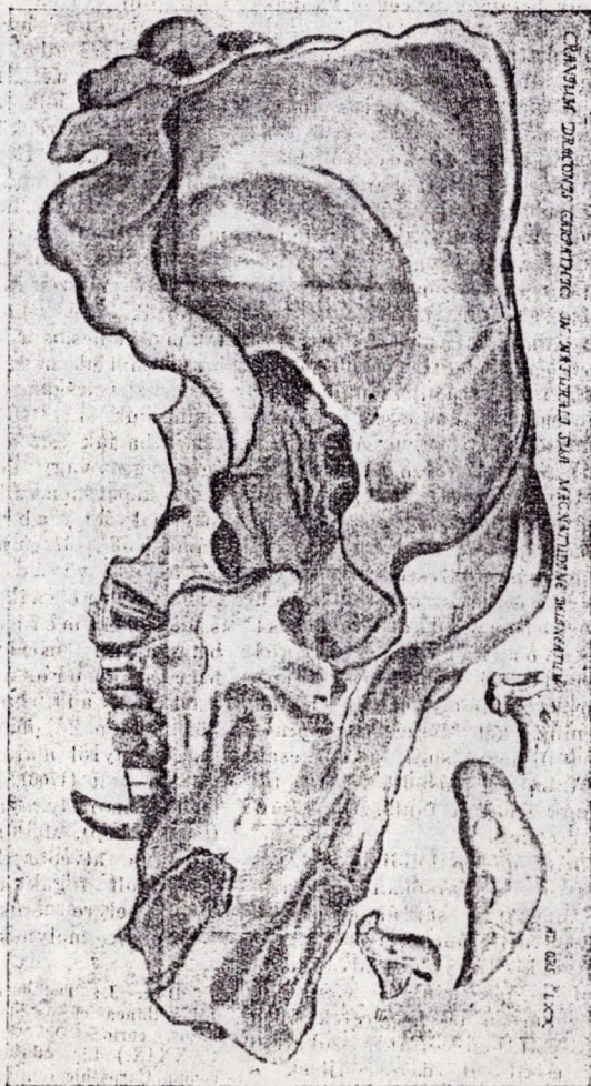
I. kép. A barlangi medve első ábrázolása.

alatta maradnak a koponyához illő hogy jobb kelendőség kedvéért a fog feltételezhető méreteinek. A leletet kiásó paraszt az üres alveolu-