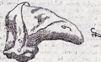
2. kép. A barlangi medve körömsontja.

A koponya rajza felett a jobb sarokban két „sárkánykőrmőt” láthatunk. Az egyik a barlangi medvének, a másik a barlangi oroszlának a körömsontját ábrázolja (lásd 2. és 3. kép).