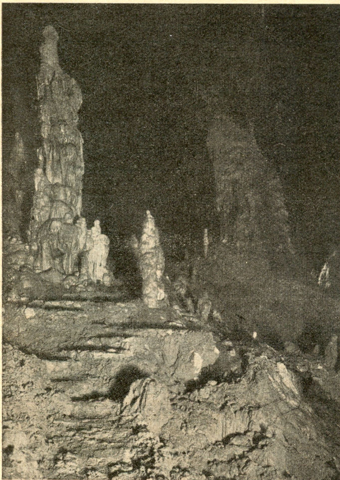
A földalatti szobrász műtermének csodái

tendőkig gondolatlan függött csak a folyosó fölött, hirtelen robajjal leszakad.