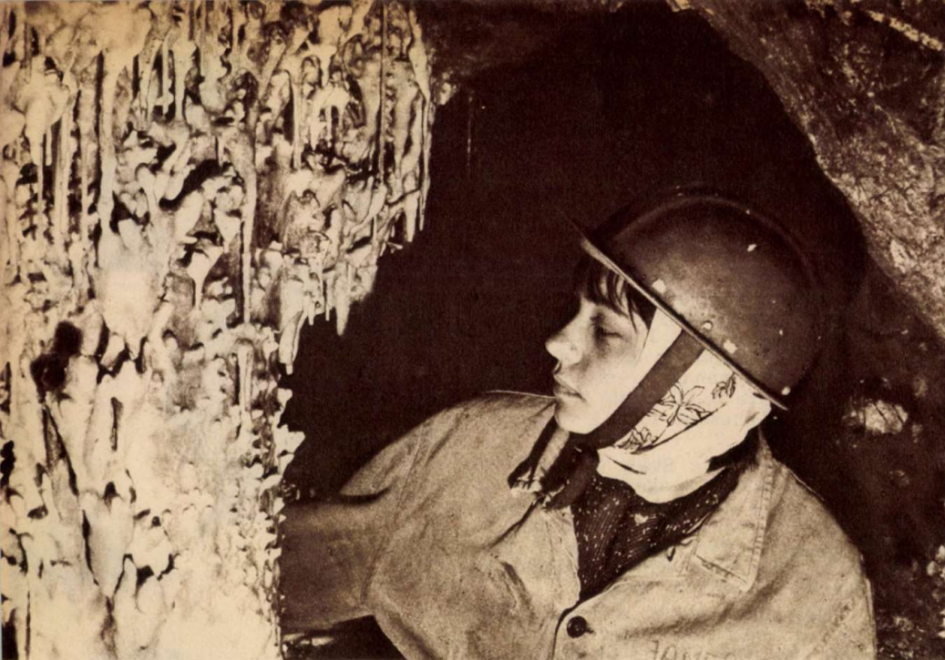
Cseppkőoszlop a felső barlangban