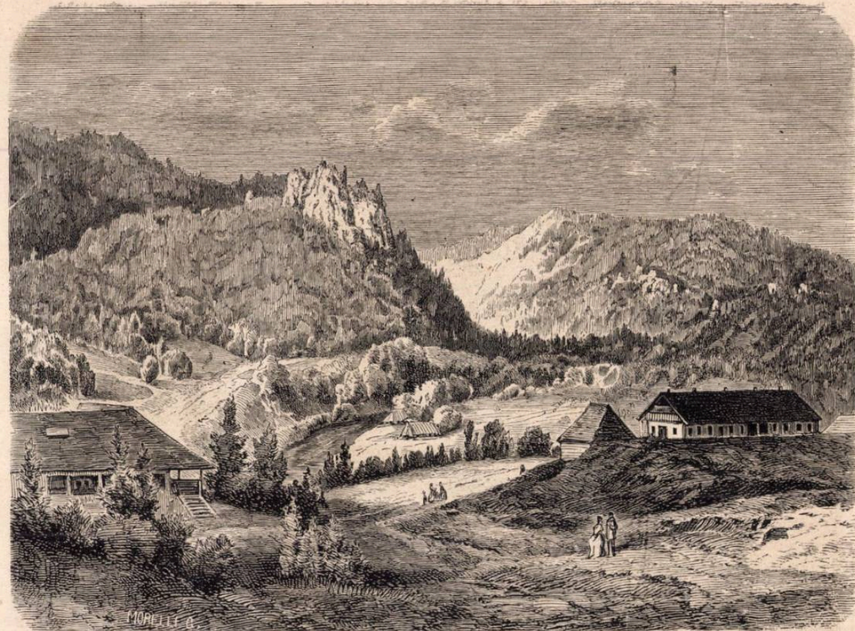
FELSŐ-SÓLYOMKŐ ÉS BÁNYÁSZ VÖLGYE A TUSNÁDI FÜRDŐVEL ÍSZEMBEN.