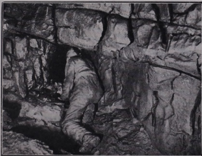
Az alsó barlangrendszerbe vezető szűk járat eleje.

Rendkívül érdekes a jósmafői Hegytető és távolabbi, ÉK-i vidéke. Az egész vidék tipikus karszt. Kiálló mészkösziklák igen erősen elkarsztosodva, rengeteg dolina, a hegység alján pedig, a völgyek fejeinél, sziklák közt fakadó igen bővizű források. A legbővizűbb források egyike a Hegytető tövében fakadó Malomforrás , melynek vize távoli esőzések idejében megzavarosodik. A forrás fölött 31 m-nyire egy kis beomlott barlangnyílást találunk, melyet talvaly kibontattunk és mely egy szép cseppköves üregbe vezetett. Az ennek alján felhalmozódott és a további utat elzáró törmelék eltávolítására azonban csak az ideai tél folyamán kerül sor. Ettől K-re, pontosan a sejtett barlanghálózat felett van egy 16 m mély, lent kitáguló zsomboly, a Kuriszlánfő-zsomboly , mely ugyancsak vízszintes barlang jelenlétét bizonyítja. Egy km-nyire ettől ÉK-i irányban még egy eltömött zsomboly van, mely állítólag két évvel ezelőtt nyílt meg és amelybe egy egész fa gyökerestül belesett. A barlanghálózat vízgyűjtőterülete a hatalmas Nagyoldal (604) platója, a Nagyoldal alatti átlagosan 300 m magas töbrös síkság és végül a Jósmafő—Szögliget közti hegyvidék, úgymint a Kopaszhegy (412 m), Magas Gálya (430 m), Lipinye (431 m) és a Mohos Gálya (421 m).