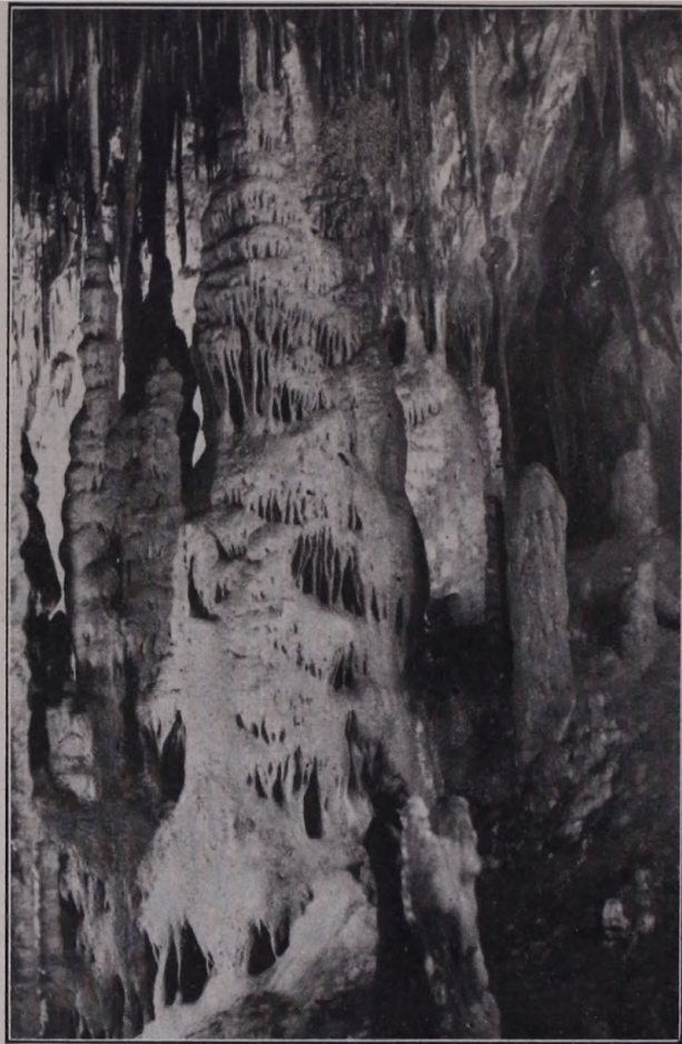
A jósvafői ágban újonnan felfedezett cseppkőves terem részletei.