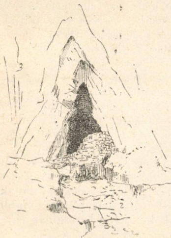
A felső elfalazott barlang a karácsonyfalva-kisbányai (boiczai) szorosban. Zidu cel d'in sus , Hunfalvy János barlang.

tinuzzi is itt lépett először Erdély földjére. Intra piatra (Kőköz) néven emlegeti a nép a meredek sziklafalak közé ékelődött nyílást, melyből feltekintve szédületes magasságban barlangnyílásokra esik tekintetünk. A vígan tovaszökellő Kis-Kaján (Kajanel) patak mellé települt falutól a 350 meter magasba emelkedő s Maguranak nevezett mésztetőig 231 meter falmeredéken kell kikapaszzkodnunk, hogy e barlangok belső szemléletét magunknak megszerezhesük. De már alulról észrevehetjük, hogy a tető párkánya alá vájódtott barlangok egyikének nyílását természetes falazat zárja el. Erre vonatkozik népies neve: Zidu cel d'in sus = Felső elfalazott barlang is. A barlangot különben kiváló tudósunk