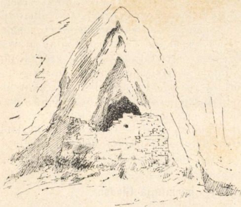
Elfalazott barlang (Pestere cu Zidu a glódi szorosban.)

A mész kötőszerral készült tömör falba két sor lőrést nyitottak. Alul-felül 3—3 lőrés vehető észre s a felsők használa-