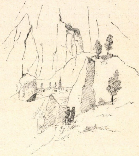
Mádai elfalazott barlang.

Az alsó lőrések a szorosból kiszabaduló patak jobb partját dominálják, míg a felső sor egyenesen a barlanghoz szolgáló területre irányult. A barlang bal falához végre tompa szög alatt