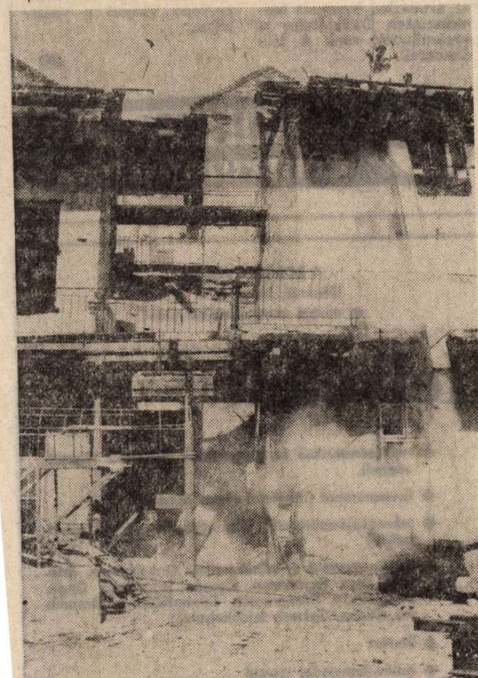
* A Pannónia Szálló ősszel már remélhetőleg kibontakozik az állványerdőből. De továbbra is megválaszolatlan kérdés, hogy mi lesz a szálló háta mögötti tömb rendezése...