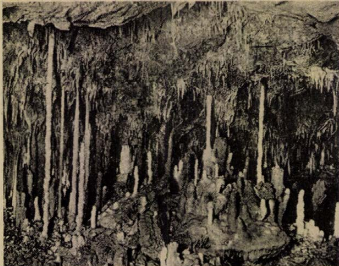
Az aggteleki Baradla-barlang egy részlete

A Kossuth-barlanghoz tartozó Tohonya-forrás vízösszetételének, vízhozamának közel két évtizedre kiterjedő vizsgálata eredményeivel arra utal, hogy ennek a barlangnak a rendszere az országban található legnagyobb közé tartozik. Feltételezett hossza 4,5 kilométer. A közel száz barlangász — köztük külföldiek is és két baranyai —, a kutatótáborozás során azon rejtélyek nyomába is ered, hogy a Tohonya-forrás vize miért produkál az időjárástól függetlenül is áradásokat, miért növekszik a víz hőmérséklete fordított arányban a vízhozammal? A kutatás kiterjed a térség még több, teljesen fel nem tárt barlangrendszerére, így például a Baradla-tetőre is.