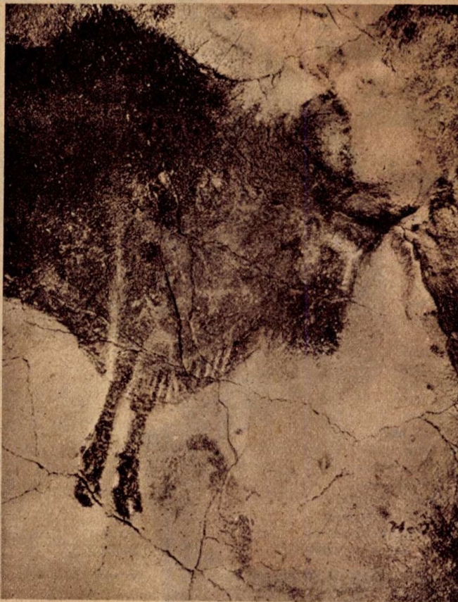
A repedezett barlangfalon maradtak fenn az ősember művészetének nagyszerű remekei.

Sokan ezeknek a rajzoknak, melyek leginkább a barlang eldugottabb és nehezen hozzáférhető részein vannak, vallásos jelentőséget tulajdonítanak, bár nem való-