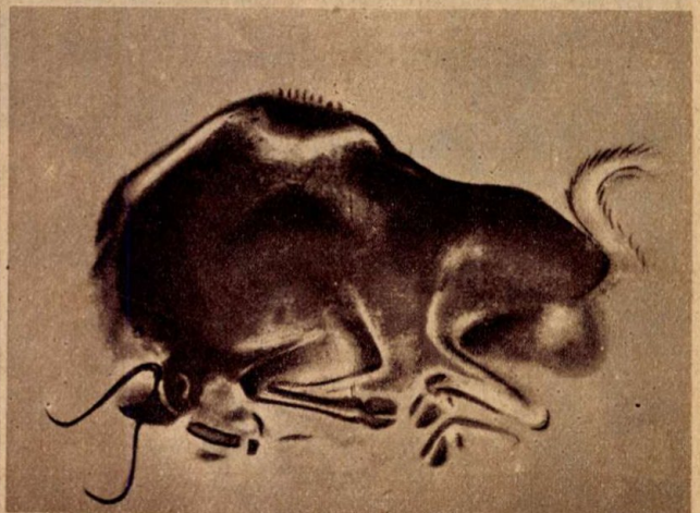
Rénszarvas és fekvő bölény képei az Altamira-barlang falán.