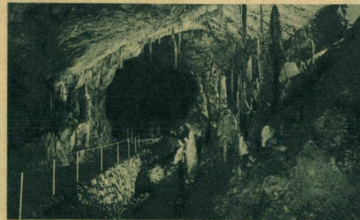
Az agyteleki cseppkőbarlangban megnyitották a most elkészült új, kétkilométeres utszakaszt.