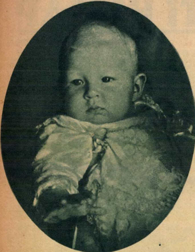
Az első fénykép az olasz trónörökspár kisfiáról, Viktor Emánuel nápolyi hercegről, akit nemrégén kereszteltek meg fényes ünnepség keretében.