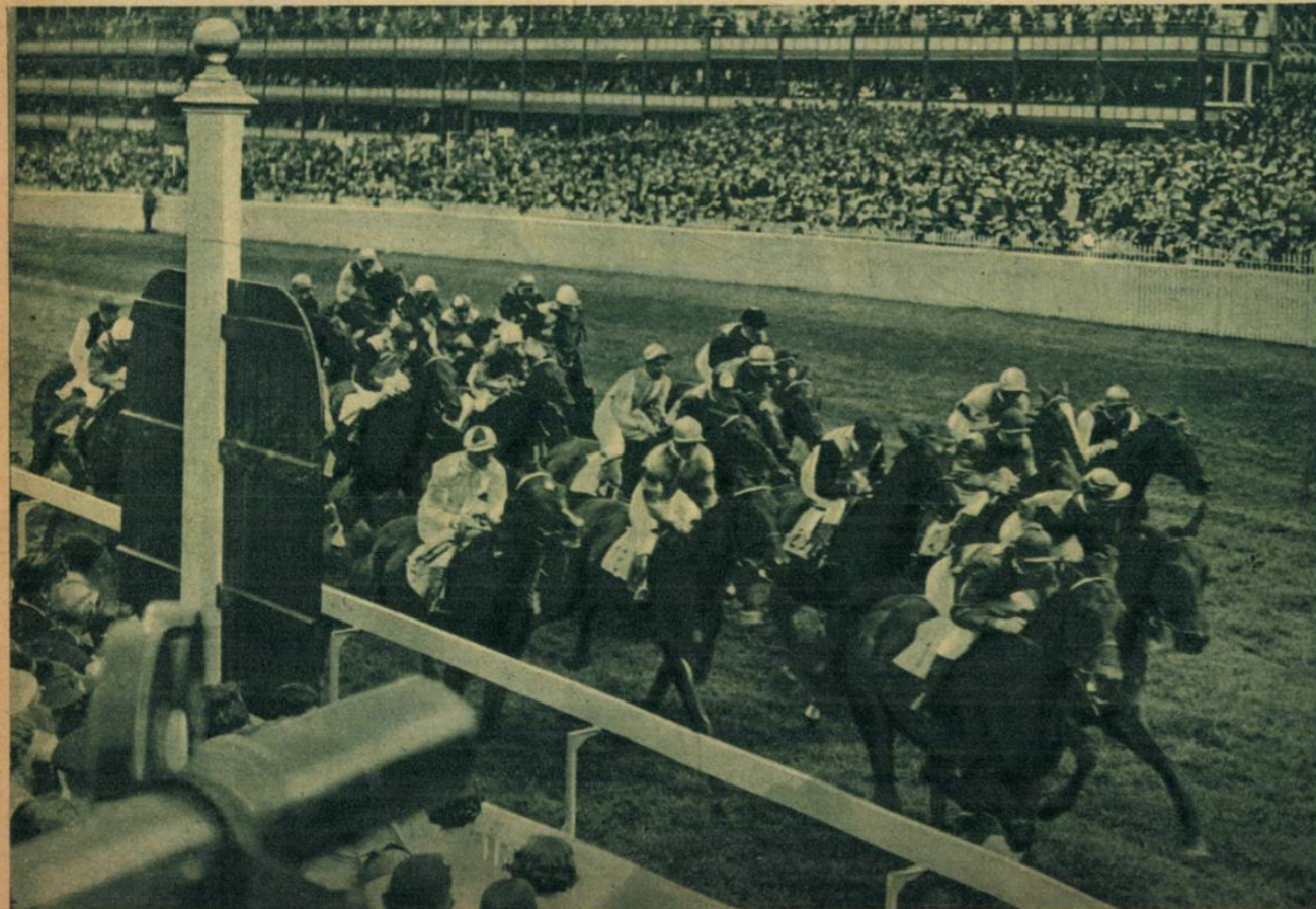
Most kezdődött meg az ascoti lóversenyszezon. Képeink: a megnyitónap első futama, amelyben rekordmezőny indult.