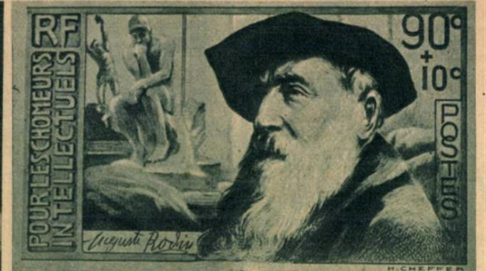
A munkanélküli szellemi munkások segélyakciója javára a francia posta Rodin, a világhírű szobrász (fent) és Anatole France, a nagy író (jobbaldalt) arcképeivel díszített bélyegeket bocsátott ki.