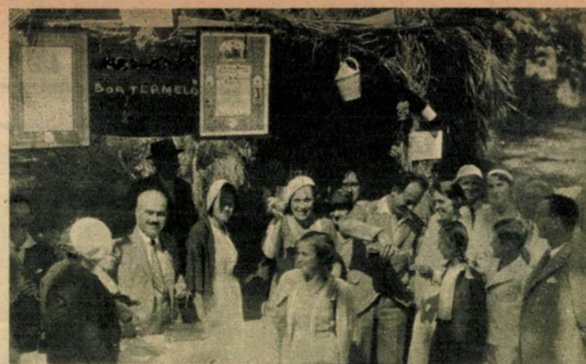
A balatoni Borhét vasárnap kezdődött meg Balatonfüreden. Képünk: borosztoló a parti sátrak közt.