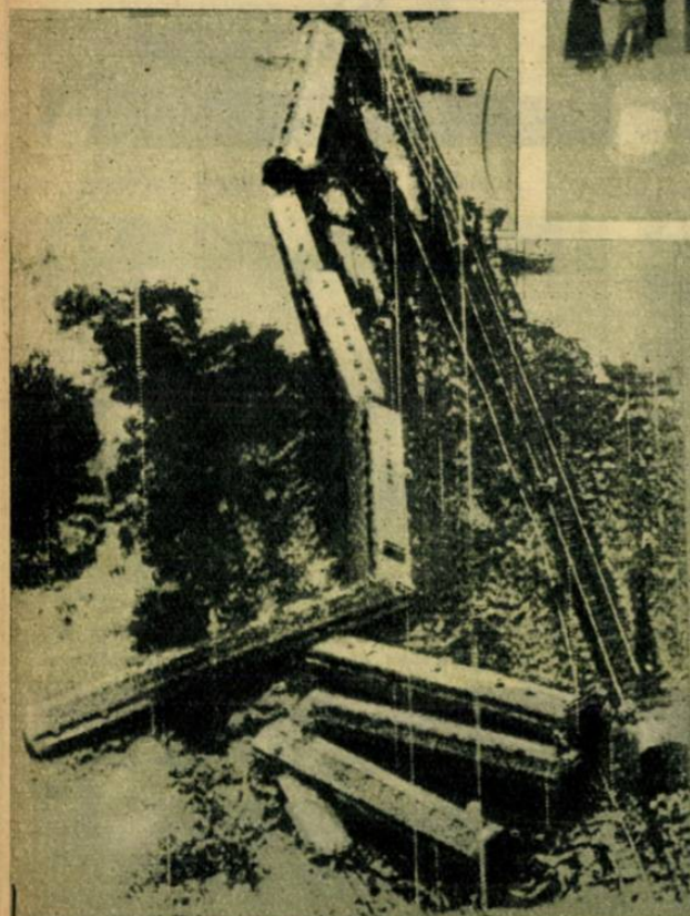
Képtávirat a multheti amerikai orkánról, mely olyan erejű volt, hogy az Anacostia-vasúti hidat szétörte s a rajta robogó newyorki eszpresszovat a mélységbe söpörte.