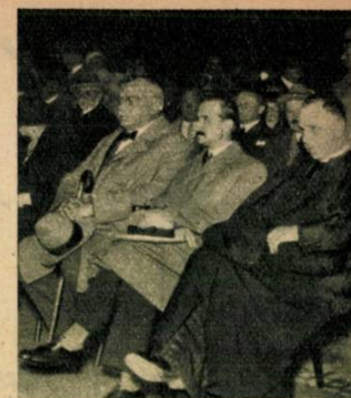
„Az ember tragédiája” előadása a Dóm-téren. Fent: Pálffy József h. polgármester, Hadsz Aladár min. tan., a kultuskormány képviselője és Glattfelder Gyula püspök a nézőtérén.