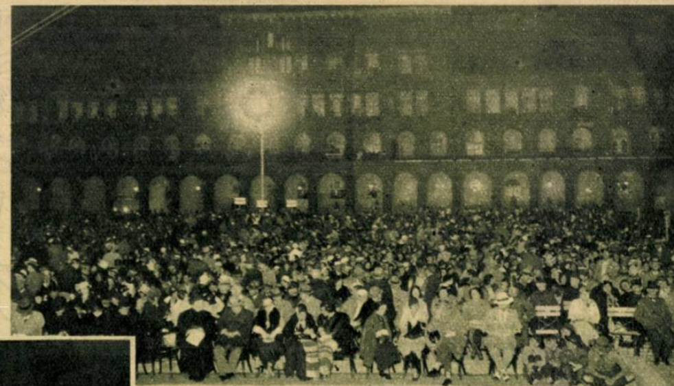
A szabadtéri „Az ember tragédiája” nézőtere.