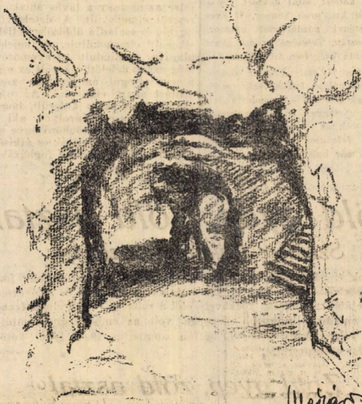
Európa legnagyobb mésztufa barlangjának, a most feltárt várhegyi barlangnak előcsarnoka

Ösmagyarok jutottak itt 50 méter mélységben a föld alatt ivóvízhez. menekülésük idején. Később a török uralom, majd a hódoltság megszűnése után