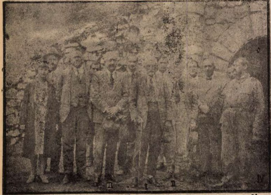
A barlang közigazgatási bejárása.