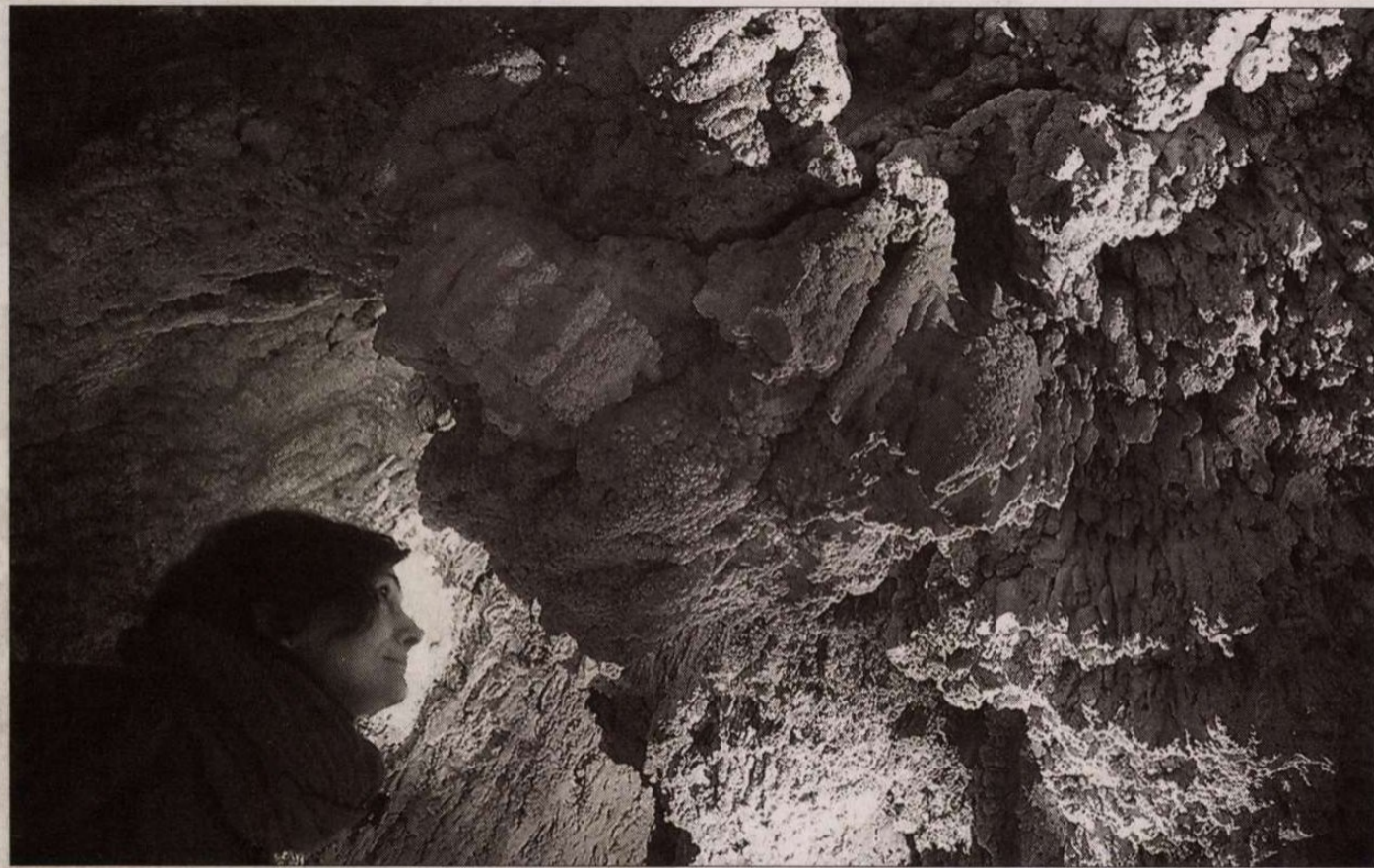
A lillafüredi Szent István-barlang a lámpacsere végéig zárva tart, az Anna-barlang (képünkön) viszont látogatható