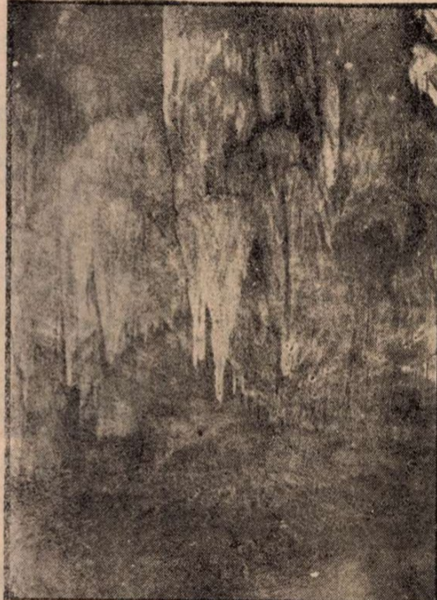
Színes csipkefűgöngyök a „Hősök emléke” felett.

Hiába minden lárma, Önérdék menni már ma