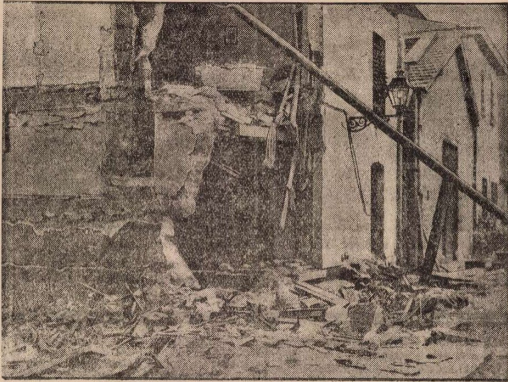
A lyoni szállóbeomlás.

— (Szeptember hetedikén kezdődik Budapesten a Nemzetközi Turista Kongresszus) Szeptember hetedikétől tizenegyedikéig Nemzetközi Turista Kongresszus lesz Budapesten. A rendező bizottság a kongresszusra minden gyalogturistával, hegymászással, alpinsporttal foglalkozó egyesület vezetőjét és tagjait meghívta. A kongresszuson előreláthatóan külföldről is igen sokan részt vesznek. Az ünnepies megnyitás szeptember nyolcadikán délelőtt tíz órakor lesz. Az előtte való napon ismerkedési estre jönnek össze a kongresszus résztvevői, akik a szakülések és a vitaelőadások után megnézik az ország nevezetességeit.