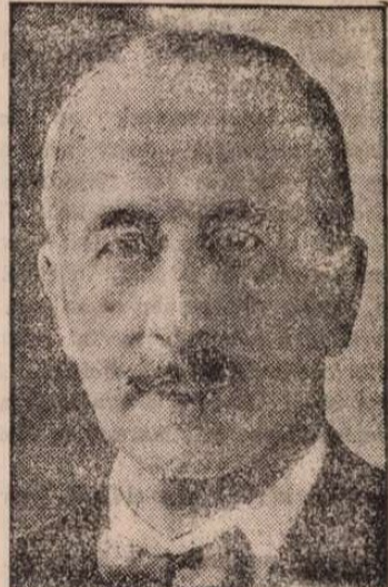
Löwenstein herceg, a német katolikus nagygyűlés idején élneke.