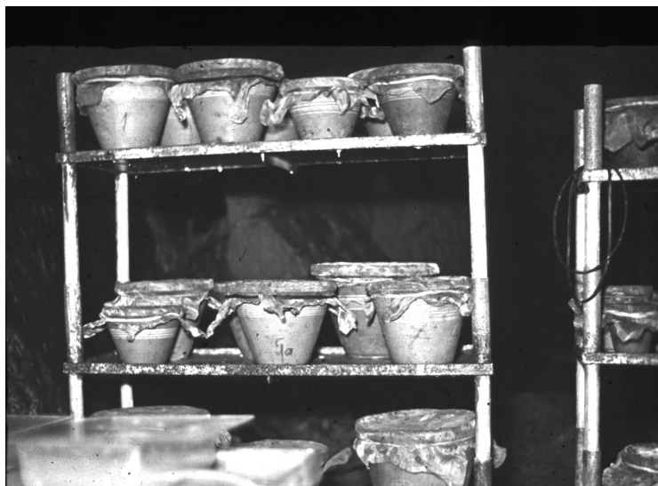
3. ábra. Kísérletek cserepekben a barlangban. Figure 3. Flower-pot; for experimental purposes.