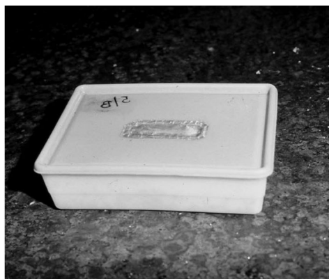
5. ábra. kísérleti doboz enchytraeidák részére. Figure 5. Experimental boks for Enchytraeidae.

Természetesen más talajállatokkal is folytak hasonló kísérletek. POBOZSNY MÁRIA vizsgálta a Sciarida legyek avarbontását, amihez szintén új, szellemes módszert dolgoztak ki (POBOZSNY 1977). Felfűjt nejlonzsákokban felfüggesztve helyezték el egy-egy tüllhálózsákocskában az avart és az ismert számú és súlyú légylárvát (12. ábra). A Diplopoda és Isopoda kísérletek cserepekben történtek (POBOZSNY 1986), a nagyobb enchytraeidák esetében pedig olyan műanyag dobozokban, amelyeknek kivágott tetején az odaforrasztott rézháló biztosította a szellőzést (5. ábra). Az állatok az avarlevelek lemezeit fogyasztották, természetesen a könnyebben bontható leveleket (pl. a hárs és a juhar) jobban, erezetig le-