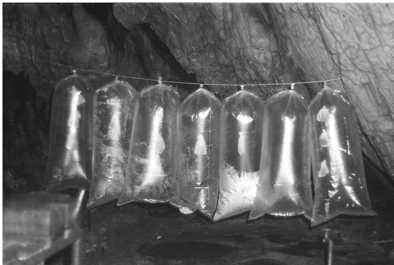
12. ábra. Felfújtt nejlonszakokban folytak a kísérletek a Sciarida-legyek esetében. Figure 12. Plastic bags for feeding experiment of Sciarida-flies.