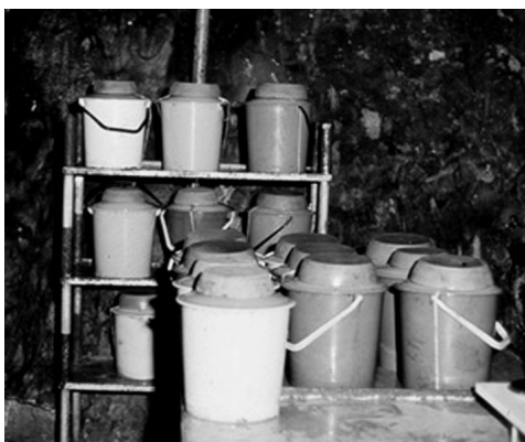
4. ábra. Kísérletek műanyag vödörökben. Figure 4. Buckets for experiments.