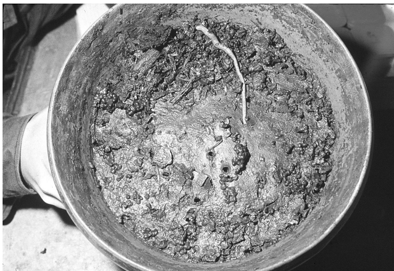
6. ábra. Levélmaradék és ürülék a cserépben a kísérleti periódus végén. Figure 6. The rest of litter and excrement of earthworm at the end of the feeding-experiments.

rágva, a nehezebben bomló fafajok levelei esetében (pl. a bükk, vagy a tölgyeknél, ezt is csak a régebbi avar esetén) éppen hogy csak némi rágásnyomot mutatva (9–11. ábra) (DÓZSA-FARKAS 1976, 1982).