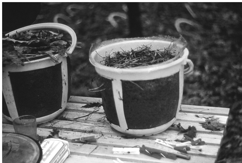
13. ábra. Szabadföldi kísérletekhez használt földbe átható edények. Figure 13. Plastic vessel placed into the soil during the field experiments.

A kísérleti eredmények alapján annak eldöntésére, hogy a gilisztáknak, ill. a többi szaprofág talajlakó állatnak milyen lehet a szerepe a természetes erdőállományokban, ZICSI ANDRÁS vezetésével szabadföldi kísérleteket is beállítottunk (13. ábra). Két kísérleti erdő-