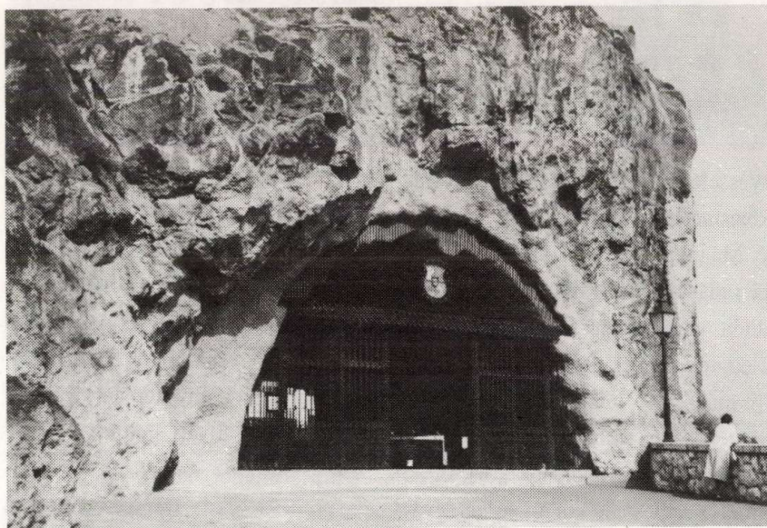
A Gellért-hegyi sziklatemplom bejárata