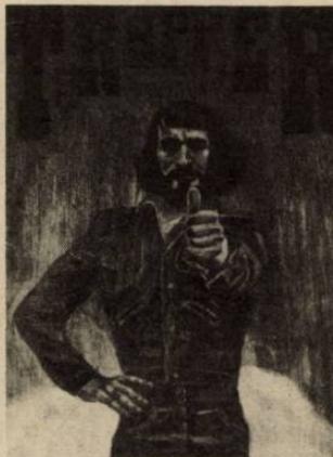
TRAPPER anyag különlegesen jó. Semmi egyéb.

A Megyei Élelmiszerellenőrző és Vegyvizsgáló Intézet a Tolna megyei Tanács Kereskedelmi Felügyelőségével végzett legutóbbi vendéglátói ellenőrzése során szomorúan konstatálhatta, minden a régióban: 14 egységben 49 mintát vettek, s a kép a szokásos, a fagyaltok 16 százaléka, a borhígítványok 22 százaléka, a presszókávék 25 százaléka nem felelt meg az előírásoknak. Azaz lötyty, lötyty... (—mz—)