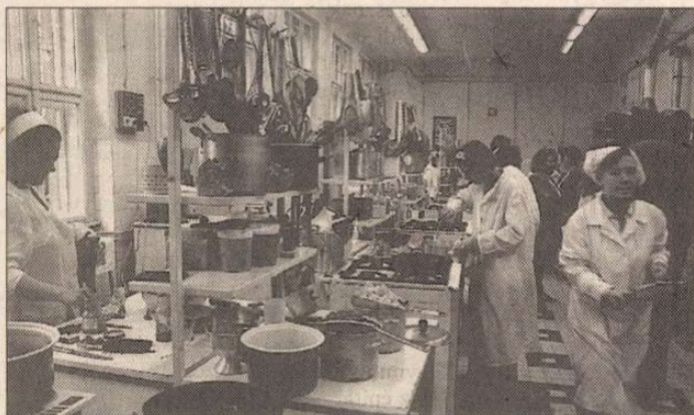
Gyakorlaton a Ramadában

– A pénzes magyarokra gondol? – Is. Mert szeretnék egy alapítványt, hogy az élet kihívásaira gyorsabban tudjunk reagálni. Az alapítványtól elsősorban szellemi és etikai támogatást várunk, de azt is, hogy az iskola önfenntartó legyen. Az alapítvány arra is módot adna, hogy a