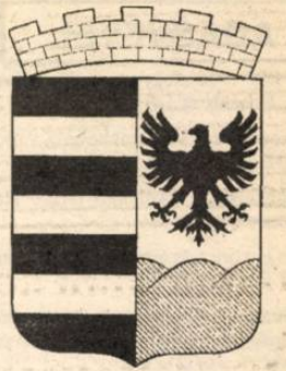
Salgótarján és környéke

Am bizonyosak lehetünk benne: lesznek még vízdíj-problémák. Mert a salgótarjáni képviselők olyan rendeletet alkottak, mellyel nem kis vihart kavartak. Kolaj László