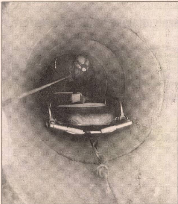
A bajba jutottat kimentik a kútból