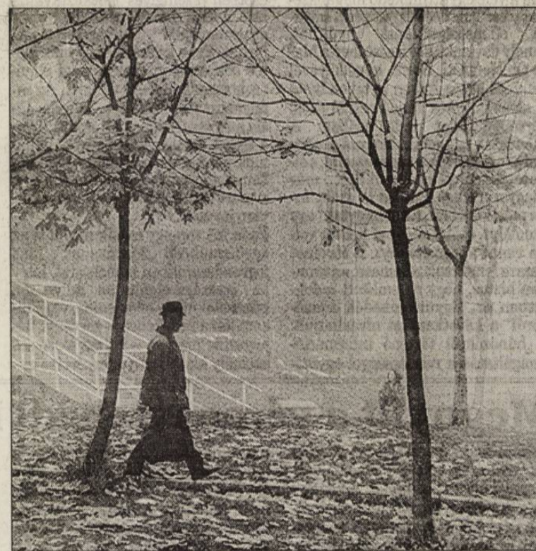
Séta az őszben

Meglehetős iramban fúródunk bele a hűvös levegőbe. A nyitott peronon könnyek szöknek a szemembe. Tekintetem cikázva járja az erdőt. Elrúgja magát a madár az ágról, levelek esznek a nyomában. Néha fejze és fűrés hangja harap a csöndbe, mintha csak azért tennék, hogy ráébresszenek a valóságra. Míndazonáltal, ha lehunyom a szemem, látom bokroktól alig takarva Dianát, a tölgyet és az erdőt, a termékenység és a vadászat gyönyörű istennőjét. Teste meztelen, az ímént furdított meg, hamvas bőrén vízcseppek csillognak. Integtet, hív a hajtó közé. Az erdő szélén, közel a sinékhez, a fák törzsébe róva feliratokat látok: monogramokat, neveket, évszámokat, néhol pontos dátumot, s a szerelem halhatatlan jelképét, szívet. Egykori szerelmeseik üzeneteit böngészgetem. Az egyik bükkfa ezüstös, sima törzsén ez áll: K.M. és