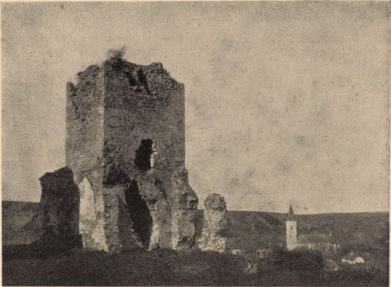
Részlet a diósgyőri várból.