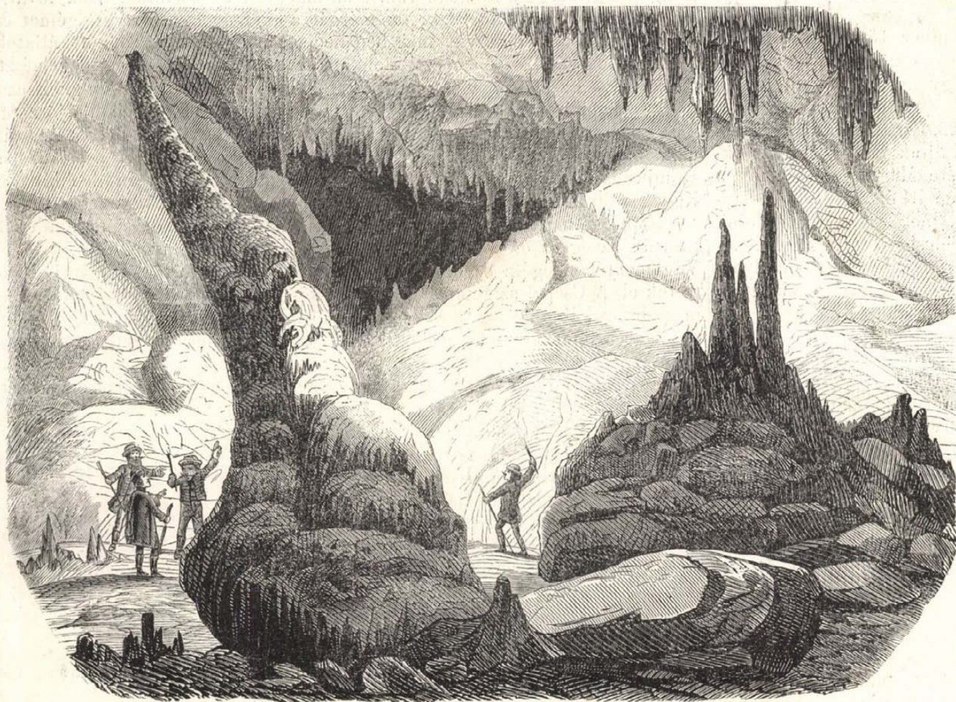
Az aggteleki barlang belseje : Pizai görbeterony. Sándy Gyula rajza után.

elérjük a csepkövekkel ékesített mennyezetes Trónust (14.) melyen tul egy tágas üreg nyilik, boltozatával a három öl vastagságú magas nádor oszlopra (15.) támaszkodva. Az oszlopon emez