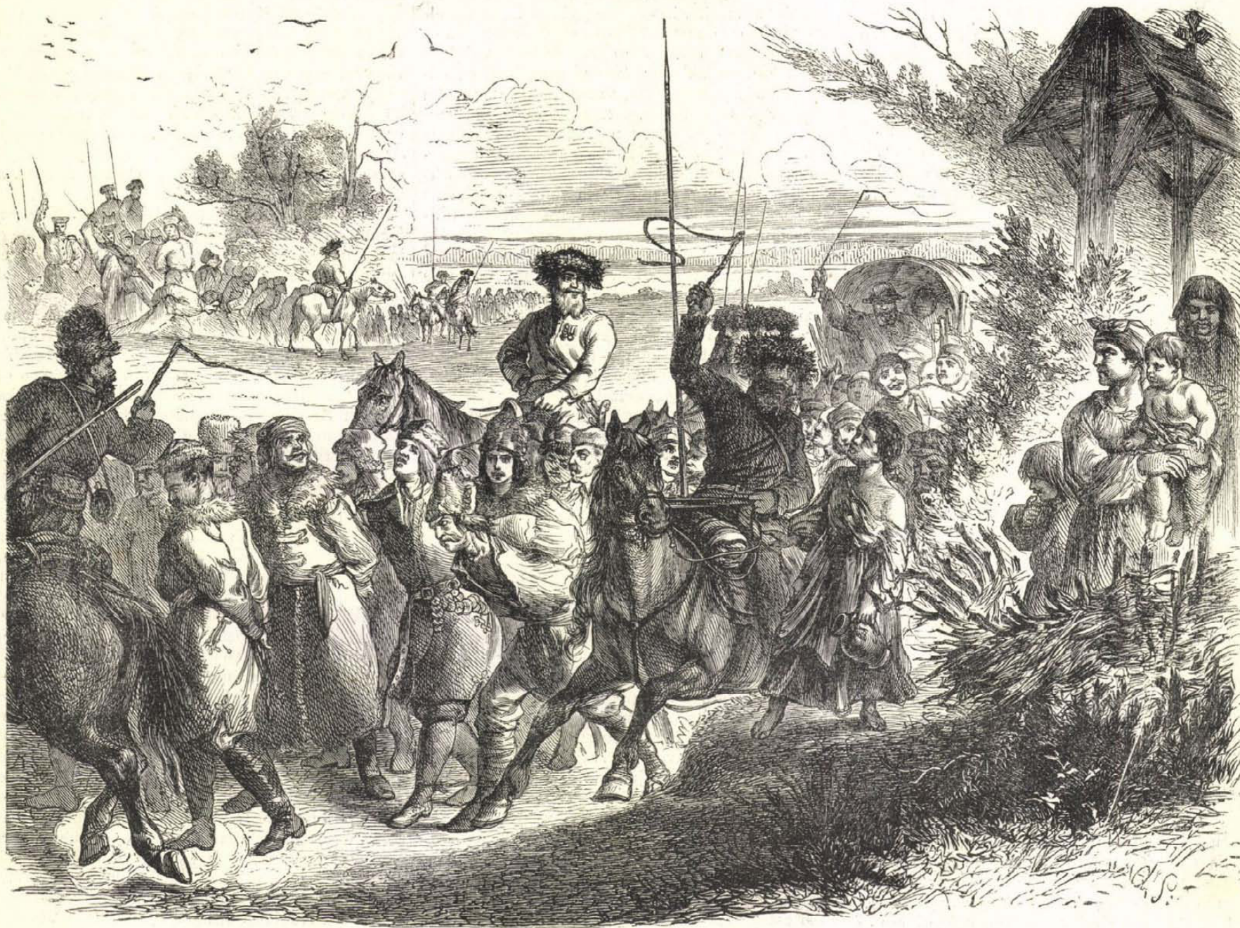
Lengyel fölkelők szállítása Szibériába.

Végre a Cerberushoz jut az utas, hol a szik-