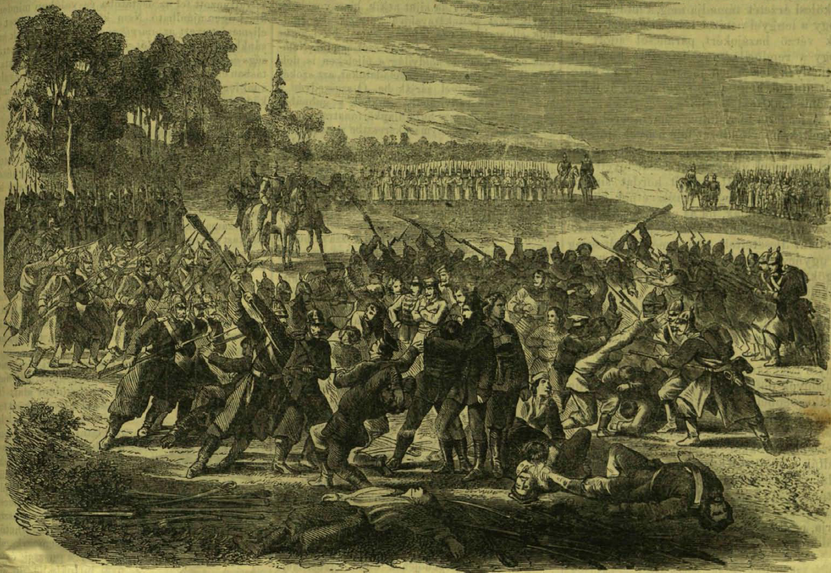
Hatvan fegyvertelen lengyel fölkelő lemészároltatása az oroszok által. Sutatownál.

Befelé törekedve, egyszer csak egy tátongó mélység szélén találjuk magunkat, melynek tulsó partján egy szikladarabokból összehullott, s fehér csepegőkő-oszlopokkal körül fogott magas halmot