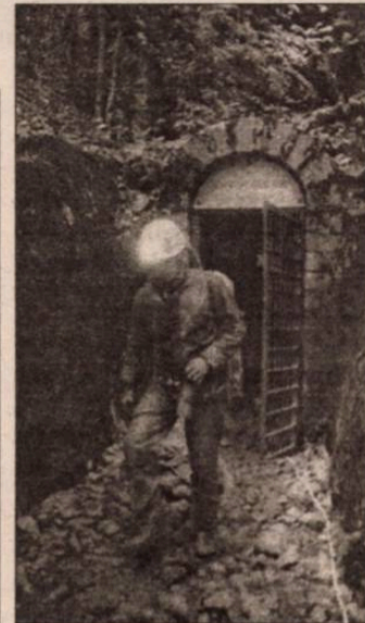
A Kossuth-barlang továbbra is rejtő titkát.