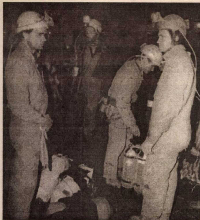
A barlangi mentők hajnalban indultak az első felderítő útra.

tésben részt vevők azonban már nem hittek abban, hogy élve sikerül felhozni a 24 éves fiatalembert. (Lapzártakor a szerencsétlenül járt K. Zoltánt még nem találták meg, a kutatását a barlangi mentők folytatták.) H. Sz.